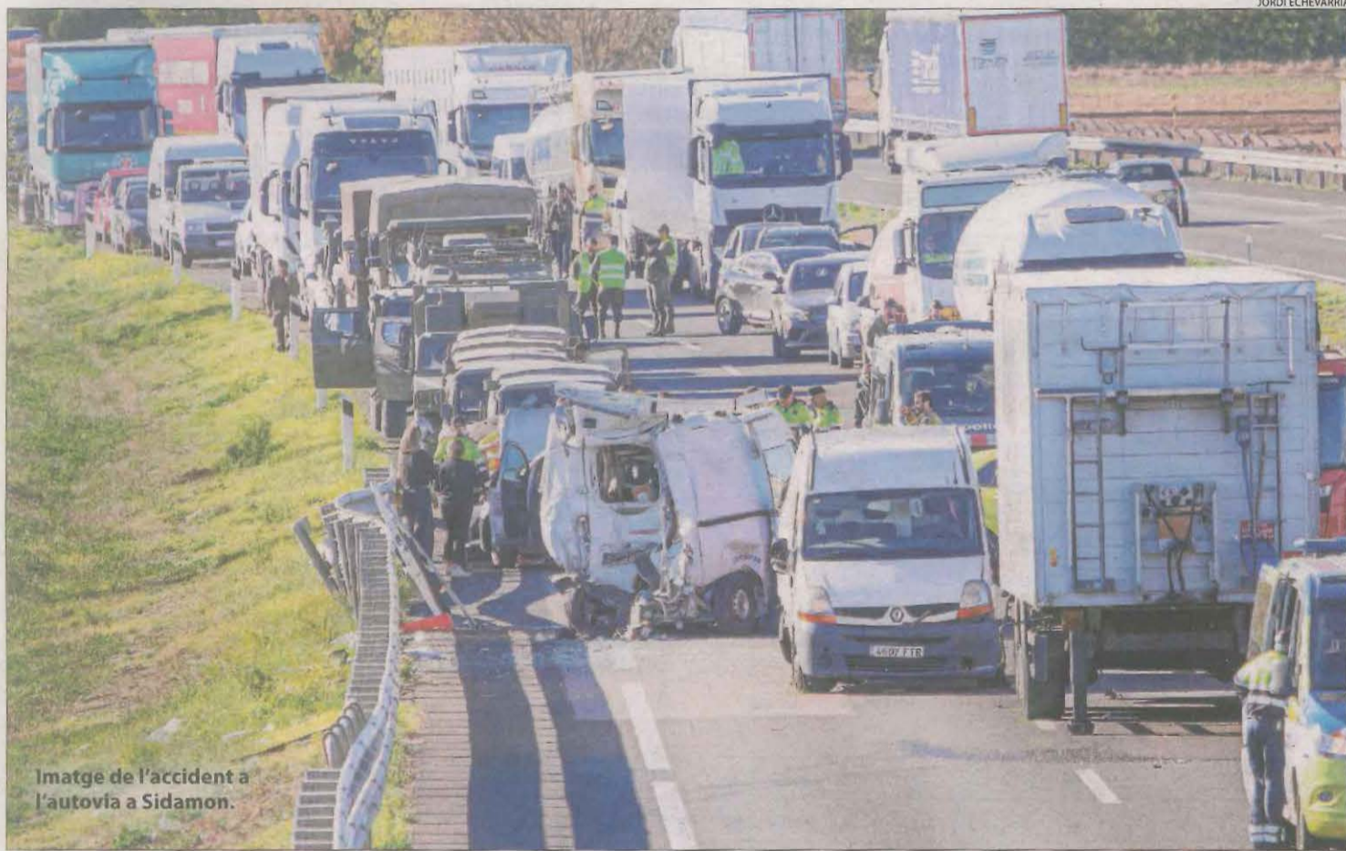
Imatge de l'accident a l'autovia a Sidamon.