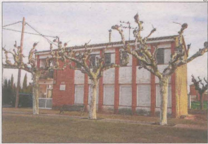
L'antiga casa del mestre es va restaurar entre el 2022 i el 2023.

En la sessió també es van aprovar les bases per regular