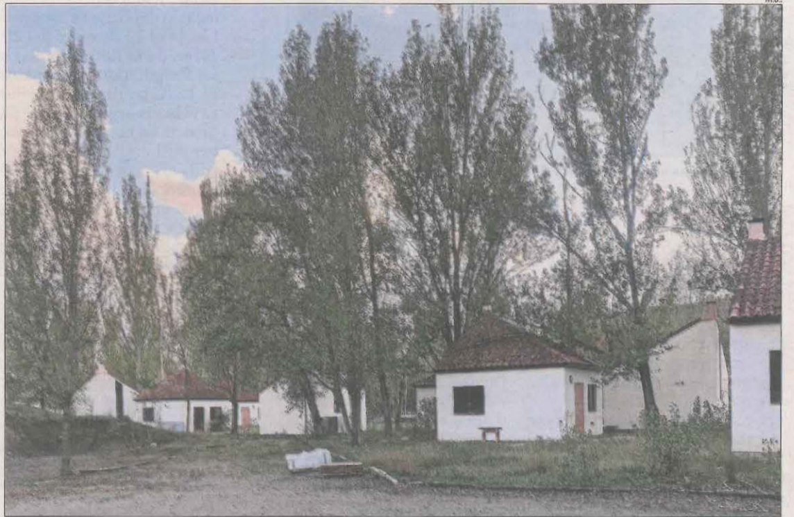
La zona de bungalows construïda a primers dels noranta i en desús des de fa anys.

El consistori de la Pobla treballa des de fa mesos en la recuperació d'aquesta zona de bungalows ja que "tal com estan ara no s'ajusten a la legalitat" que marca el decret de Turisme de la Generalitat de l'any 2020 que també regula els allotjaments singulars.