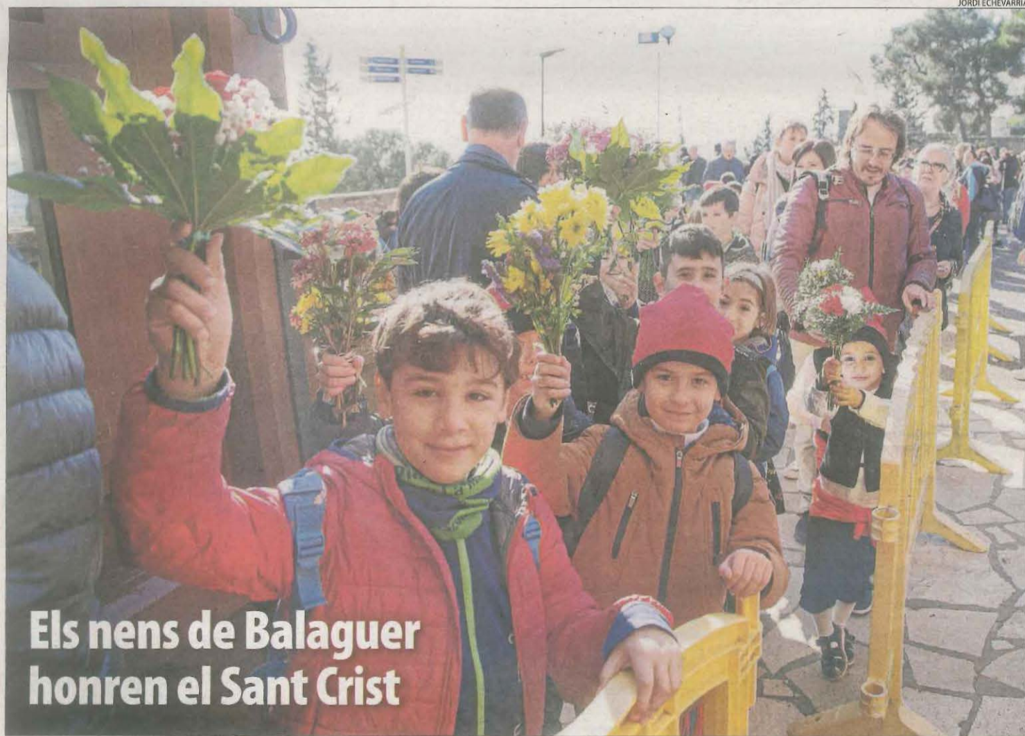
Els nens de Balaguer honren el Sant Crist