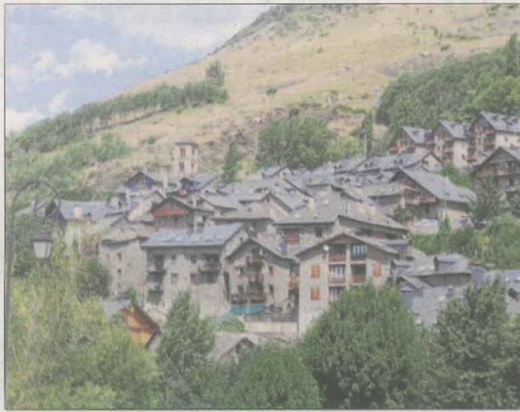
Imatge d'arxiu d'una vista de Taüll, a la Vall de Boí.