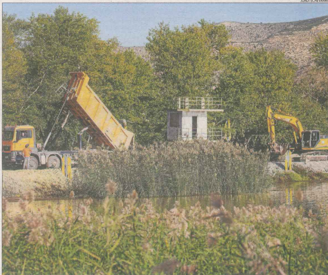
Els treballs de la prova pilot per a la supressió de sediments del riu a Mequinensa.

diu de Lleida hauran de començar les noves campanyes de regs amb restriccions". Va assegurar que aquestes dos subconques no s'han vist beneficiades pels continus fronts de precipitacions dels últims dies, que han suposat importants millores en altres conques. "Les pluges les han vorejat i no han deixat aforaments d'importància que facin augmentar el cabal dels rius", va assegurar.