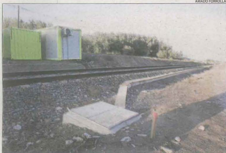
Les obres del baixador que donarà servei al polígon El Segre.