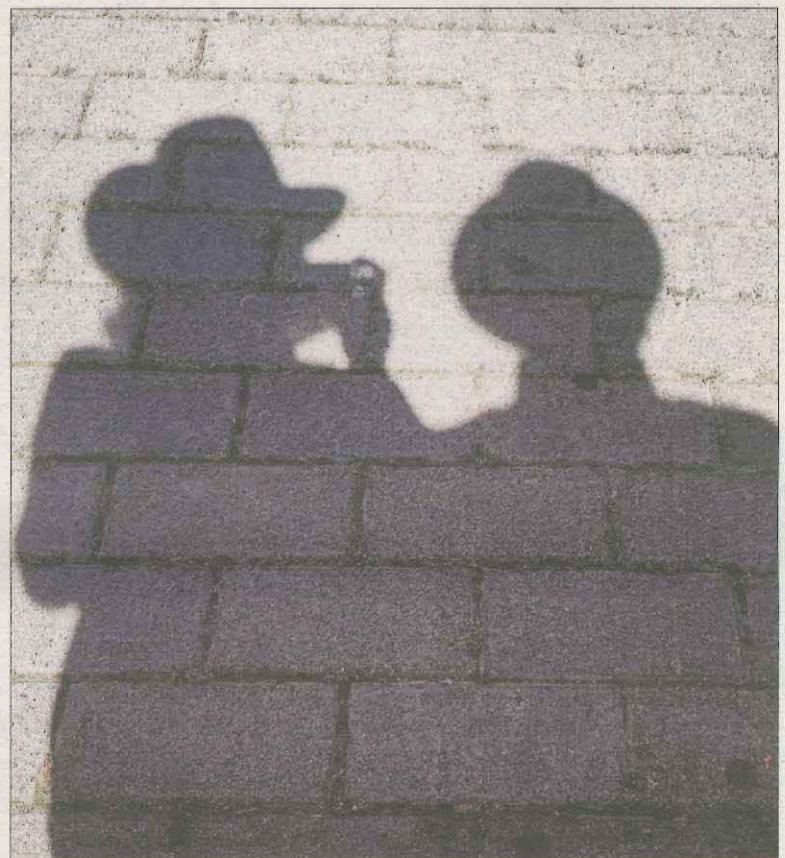
Companyia. La Rosa ens envia aquesta bonica imatge de les ombres de dos persones caminant juntes i acompanyant-se fins al final del camí.