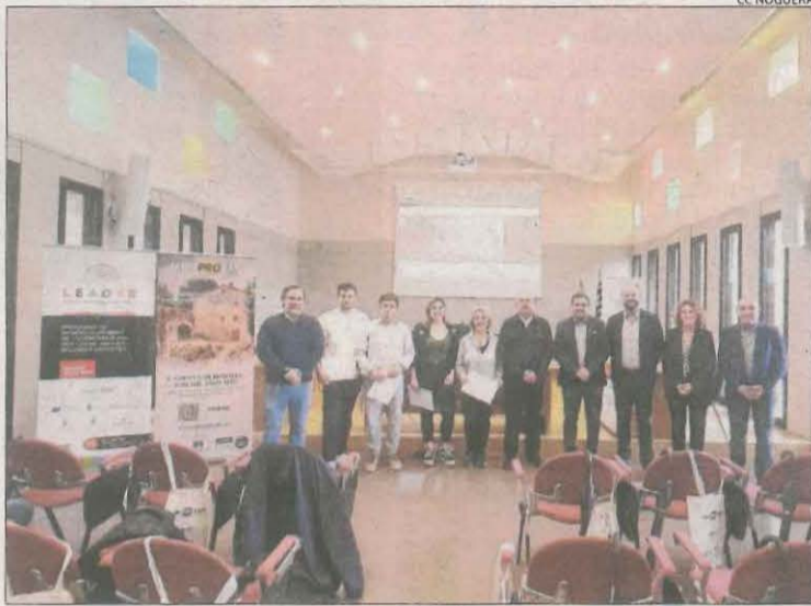
Presentació del portal web al consell de la Noguera.

El portal digital promociona 400 pobles de tot el territori