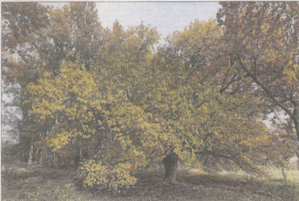
Senyals de la tardor. Imponent noguera a prop del pantà de Sant Antoni, al terme de Salàs de Pallars, mostrant amb tota plenitud els senyals de la tardor, del Salva.