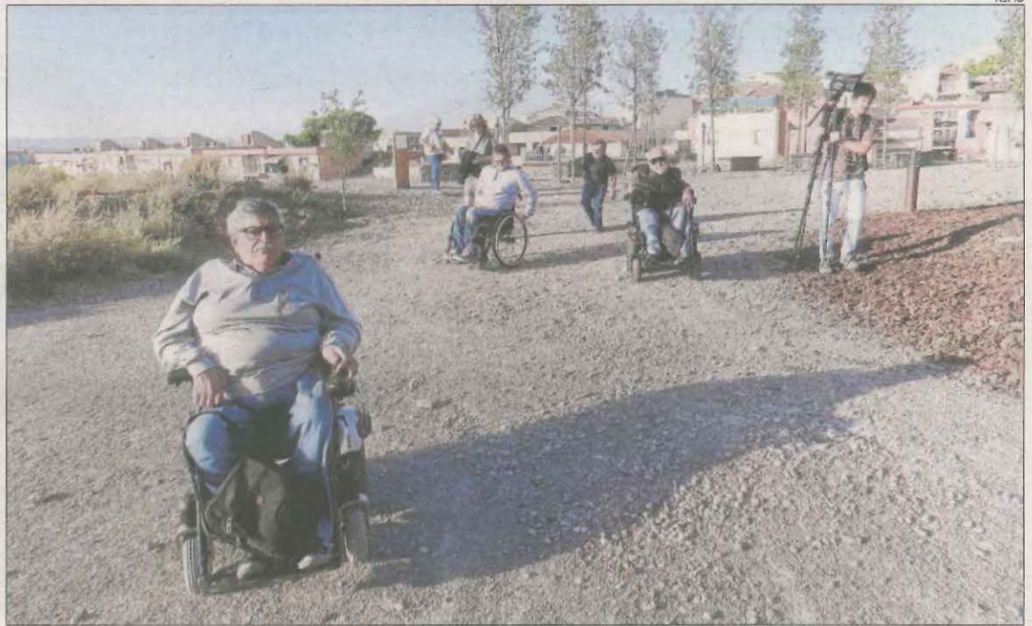
Imatge d'arxiu durant l'estudi sobre accessibilitat al bosc urbà de Magraners a Lleida.

De les 23 vulneracions detectades, quinze han tingut lloc al Segrià, cinc a l'Urgell, dos a la Noguera i una a l'Alt Urgell. Quant al perfil, el 52% dels afectats han estat dones i la majoria tenen entre 50 i 64 anys. A més, el 43% estava a l'atur. Així mateix, el principal agent vulnerador ha estat el personal d'empreses privades (30%) i de l'administració local (26%). L'espai on se n'han produït més és al lloc de feina (30%) seguit d'espais públics (26%). Només quatre persones van denunciar aquestes situacions i la resta no ho va fer al considerar que "fer-ho no servia de res".