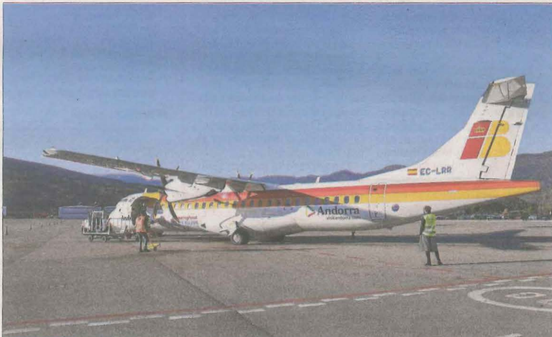
Imatge d'arxiu d'un avió d'Air Nostrum a la Seu.

LLEIDA | L'aeroport Andorra-la Seu estrenarà aquest hivern la nova ruta a Palma de Mallorca. El govern andorrà ha aprovat l'adjudicació del concurs per dur a terme aquesta operativa, que anirà a càrrec d'Air Nostrum, l'única companyia que va presentar una oferta. L'aerolínia farà dos vols, d'anada i tornada, a partir del dia 5 de gener fins al 31 de març. Així, un sortirà els divendres des de les illes a les 08.45 hores i tornarà a les 10.45 i l'altre s'oferirà els diumenges des de Palma a les 13.45 hores i amb tornada a les 15.45. El bitllet tindrà un preu a partir de cinquanta euros i amb