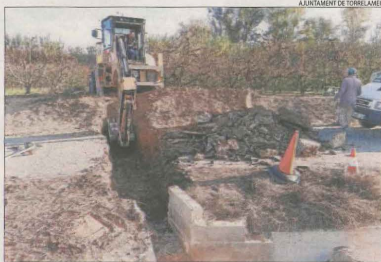
Reparen una canonada de reg ■ Torrelameu ha reparat d'urgència la ruptura d'una canonada de reg al camí del Comejar. Els treballs han obligat a tallar aquest vial durant dos dies fins que s'ha renovat la canonada i el ferm del camí rural.

Santa Anna també perd volum embassat, amb 7,63 hm 3 menys que el novembre del 2022. Tanmateix, Escalles sí que ha guanyat reserves i es troba al 70% de la seua capacitat. A la Noguera Pallaresa, tant Talarn com Camarasa estan per sota de la seua capacitat mitjana. Pel que fa a les reserves de neu, a tot el Pirineu són de 228 hm 3 i serà necessari que es mantinguin en els propers mesos.