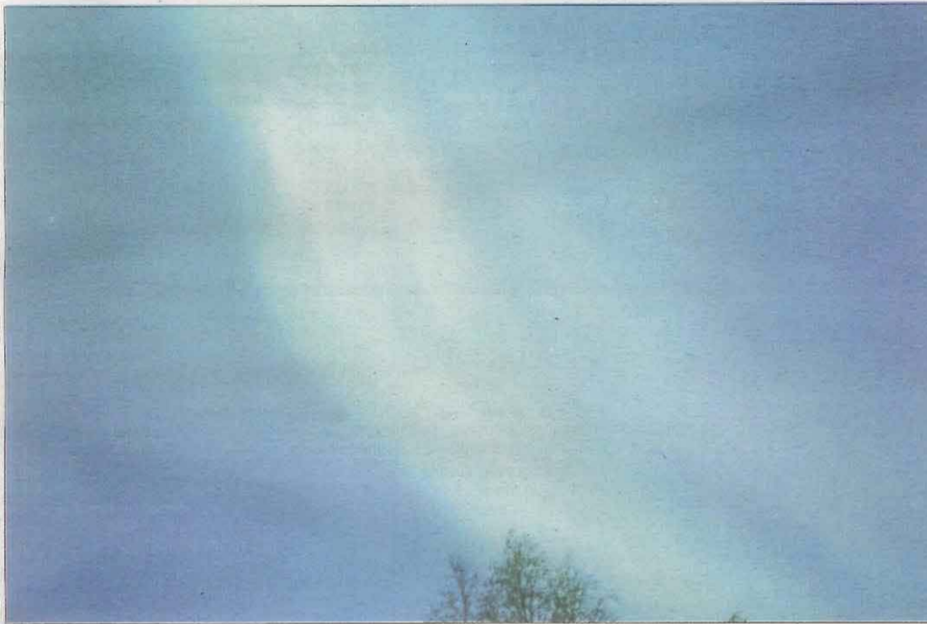
De nit. I en una altra part del món, l'Araceli fotografia una aurora boreal des de Tromsø, Noruega. Una autèntica bellesa per als nostres ulls.

Amb la col·laboració de l' Hotel Casa Irene