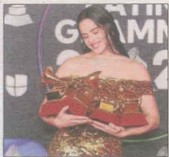
Rosalía en els Grammy 2022.