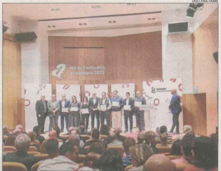
Alguns dels guardonats, dimarts a la nit.