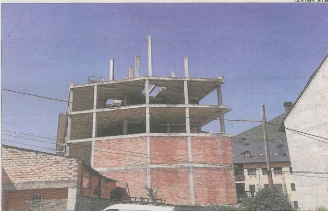
El bloc d'habitatges inacabat que l'Incasòl preveu adquirir a Sort.

Aquestes subvencions havien estat objecte de crítiques per part de col·lectius del Pirineu com la plataforma Stop Jocs Olímpics, al considerar inadequat subvencionar l'esquí i la innivació artificial, en especial en època de sequera.