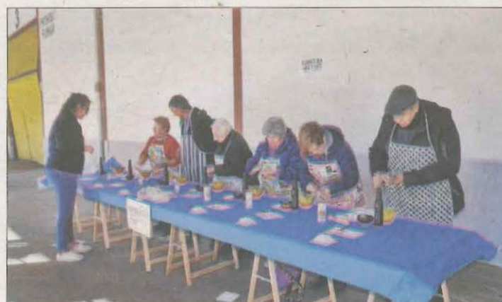
Posaran a prova la perícia en elaborar un alloli.

Finalitzarà la mostra amb un dinar popular amb tiquet adquirit anticipadament.