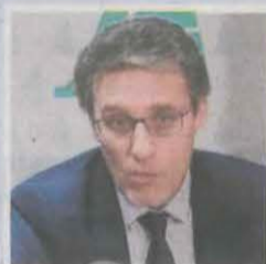
Secretari General de Recursos Agraris

«L'aposta d'Actel i Fruits de Ponent és una excel·lent notícia i tindran el suport sense fissures del ministeri»