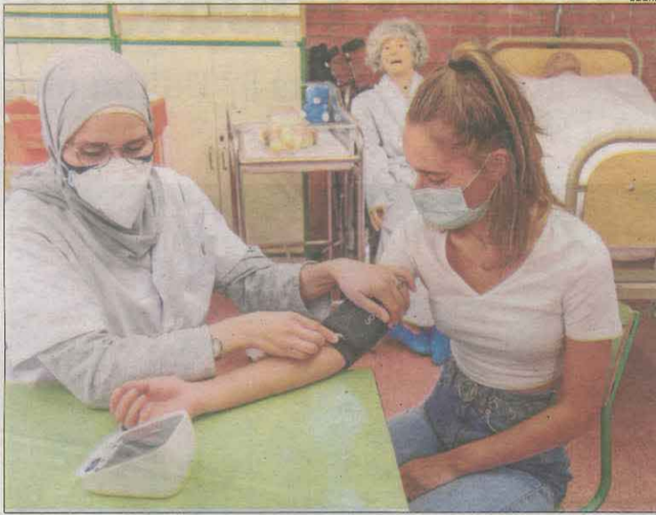
Imatge d'arxiu d'un cicle d'FP de la branca sanitària.

La Generalitat vol adaptar l'oferta de Formació Professional a les necessitats del mercat i frenar el nombre de vacants, que s'han disparat en els últims anys. En el curs 2022-2023 n'hi