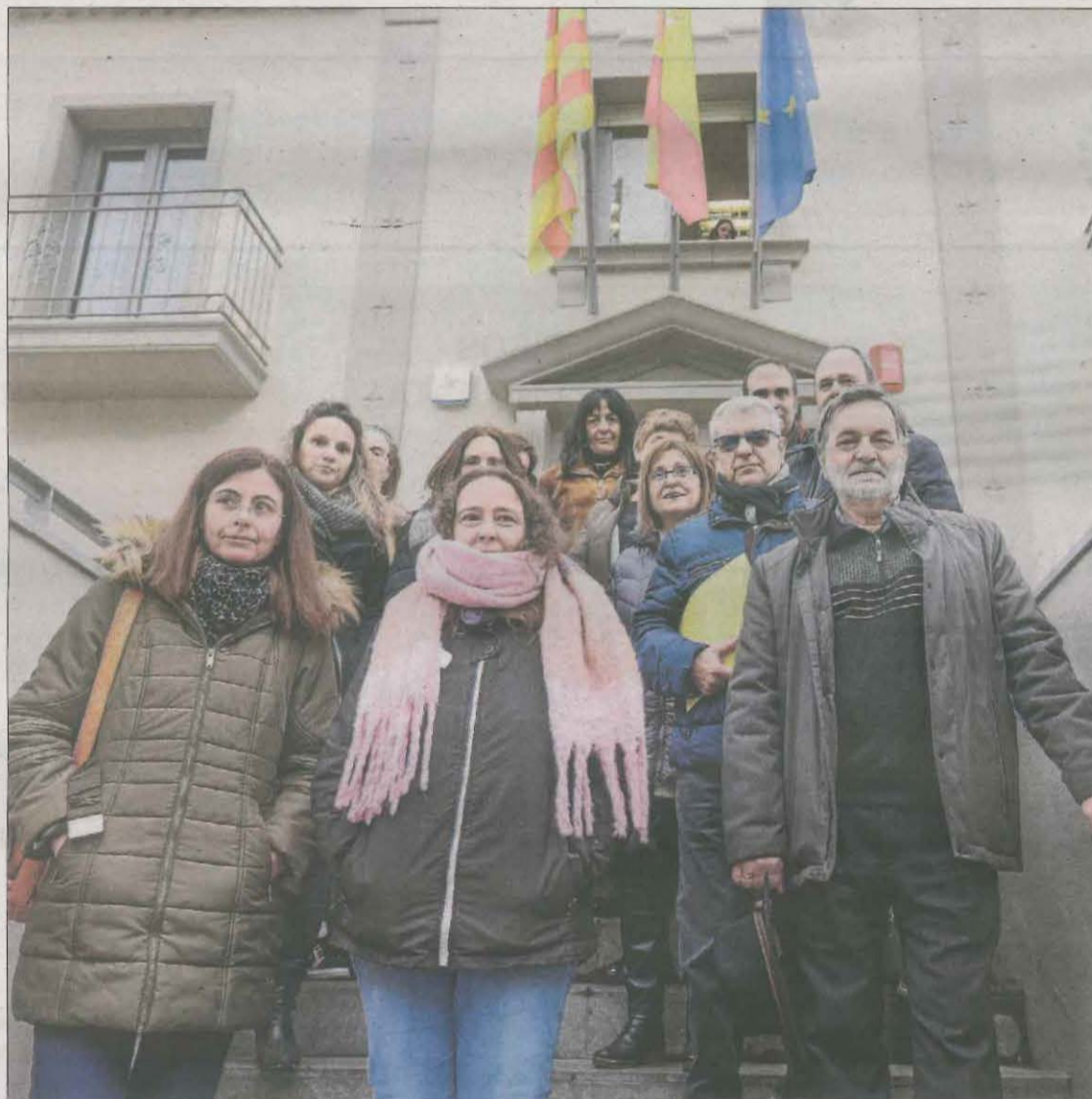
Secretaris i secretàries del Registre Civil de les Garrigues es van reunir ahir amb Justícia a Lleida.

Vielha ja compta amb el sistema i Lleida el tindrà ben aviat. Estan pendents Balaguer, Tremp, la Seu, Cervera i Solsona.