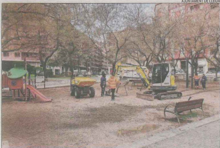
Operaris treballant a la plaça del Clot de les Granotes.