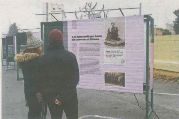
L'estació de Balaguer acull l'exposició commemorativa del centenari