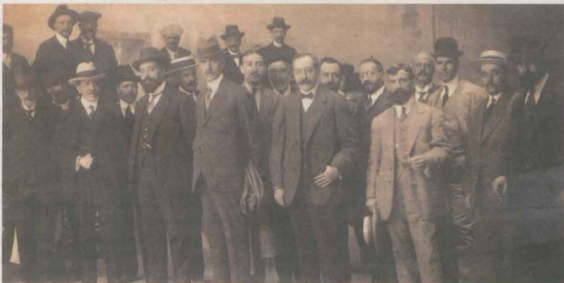
A dalt, imatge de Macià a la manifestació per reivindicar la línia el 1914; i a baix, l'estació de ferrocarril de Lleida als anys 25-30

Fa 10 anys, amb motiu del 90 aniversari de la inauguració del ferrocarril, el Museu de la Noguera va preparar una exposició retrospectiva sobre la línia que va proposar un recorregut per la història d'aquest ferrocarril a través de diversos panells