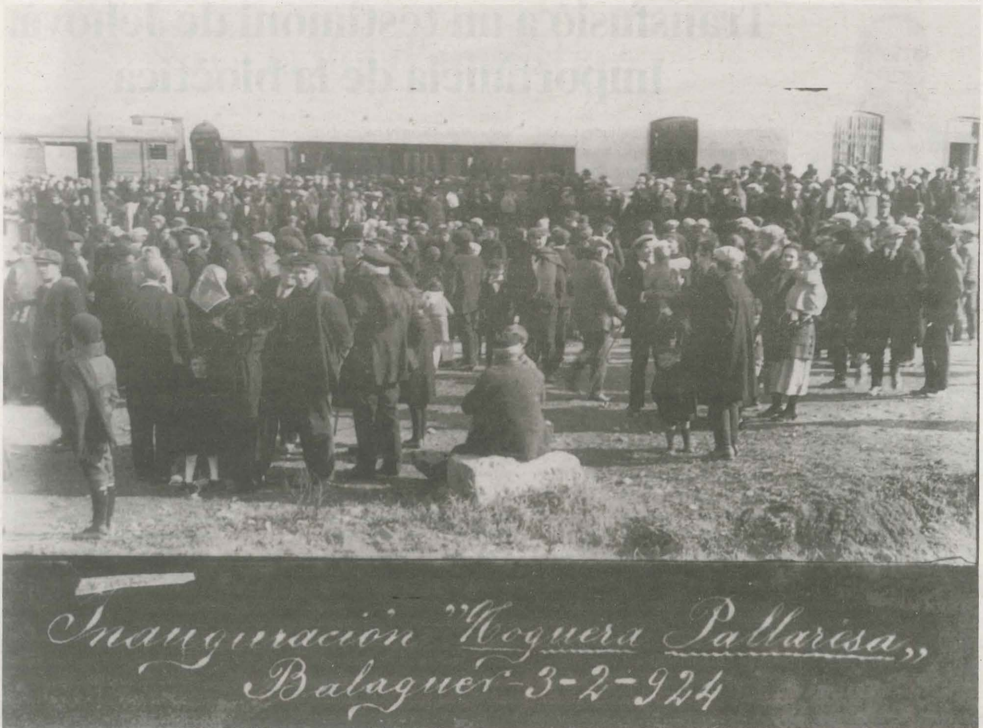
Centenars de persones en la inauguració de la línia a l'estació de Balaguer, l'any 1924

ho és el Segarra-Garrigues". "Fins i tot va haver-hi algun diari específic que parlava i comentava com havia de ser el ferrocarril", afegix Barrull.