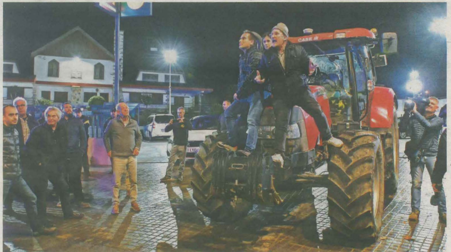
Concentració de pagesos a Tàrrrega, on ahir es va fer una marxa lenta de tractors

Quatre cooperatives demanen la baixa de socis de la FCAC