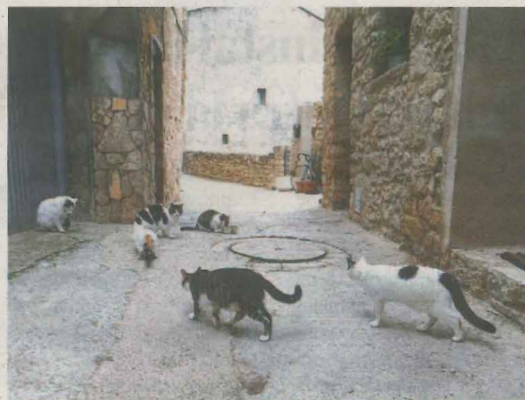
Mitja dotzena de gats a d'Isona, al Jussà