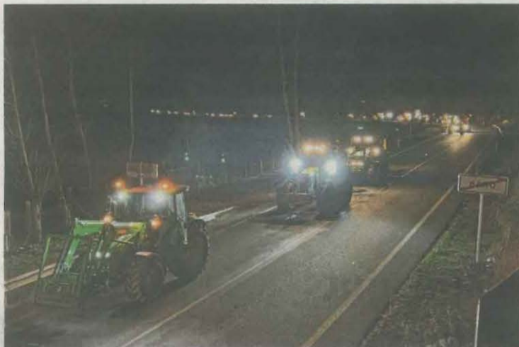
A l'esquerra, tractors al seu pas per Baró, i a la dreta marxa lenta per l'Alta Ribagorça