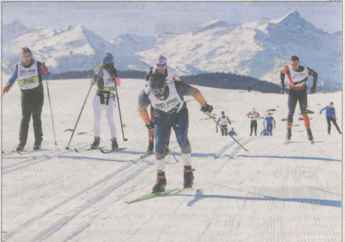
El Pla de Beret serà l'escenari dels Campionats d'Espanya d'esquí de fons a començaments de març.

L'altra modalitat de neu més afectada ha estat l'esquí de fons que, com el múixing, es disputa en zones on no s'acostuma a produir neu artificial. En aquest sentit, s'han hagut de suspendre proves com la tradicional Marxa Pirineus, prevista a Lles al gener, o la quarta fase del circuit Snowkids a Tuixent, a més de posposar els Campionats de Catalunya absoluts i de base que