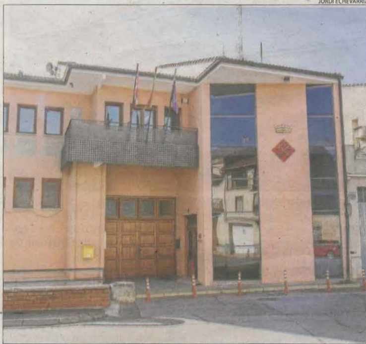
Imatge d'arxiu de l'ajuntament de la Portella.

per la seua part, va recordar que el litigi és en mans dels seus advocats i va dir desconèixer la providència que envia el cas a la Fiscalia i l'embargament. La quantia a pagar a l'exsecretària municipal en concepte de salaris de tramitació augmenta a raó d'uns 3.900 € mensuals. El mig milió en què es calcula actualment, dotze anys després de ser acomiadada, suposa la meitat del pressupost total de l'ajuntament de la Portella, de poc més d'un milió d'euros. La mitjana pressupostària d'anys anteriors és menor i se situa en uns 700.000 euros.