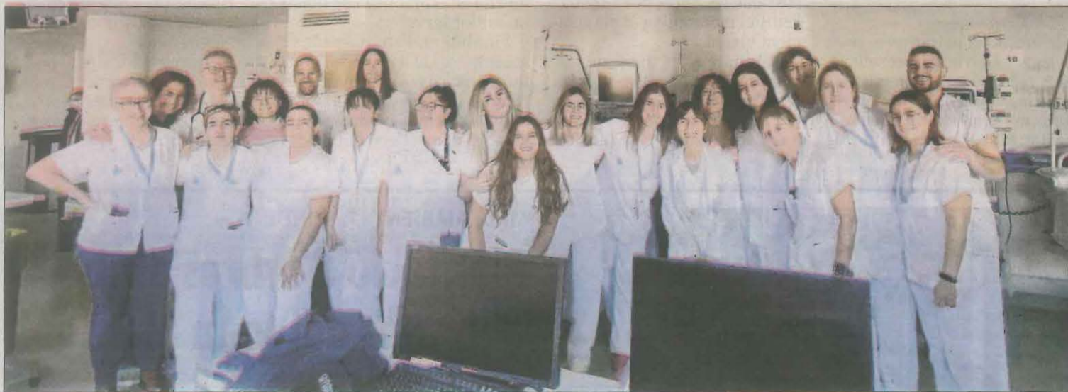
Les unitats d'Hemodiàlisi de l'Arnau i de l'Hospital Comarcal del Pallars han vist certificada la seua qualitat.