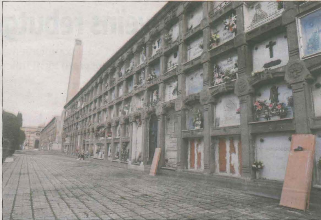
Dos dels nínxols les làpides dels quals van ser destrossades, ja reparats, al departament de Sant Josep.

Fonts policials creuen que l'autor o autors buscaven joies o altres objectes de valor