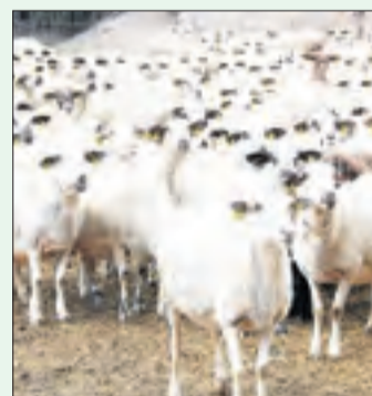
Mercolleida ha obert una llotja.

Assolir, i sobretot, mantenir un preu de venda digne, és motiu de preocupació per als ramaders, i un taló d'Aquilles per a la sostenibilitat del sector. Una cotització de referència en l'àmbit estatal que fixa la primera llotja d'oví, posada en marxa per Mercolleida al novembre. En llet, els preus percebuts per la llet d'ovella i cabra tradicionalment han