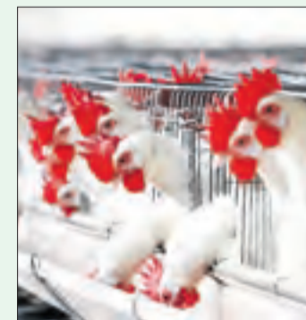
Ponent, potència avícola.

A curt i mitjà termini, es preveu que l'activitat continuarà molt condicionada per factors com el context geopolític, així com pels efectes que la influència aviària pot tenir. Preocupen especialment l'efecte de les normatives de la UE sobre el benestar animal,