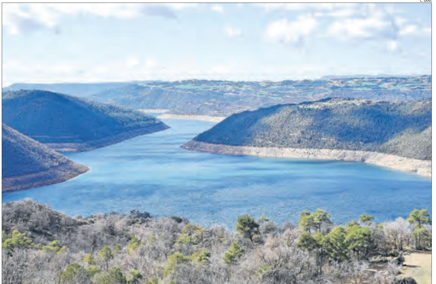
Vista des de Tiurana del pantà de Rialb, al Segre, que acumula més aigua que fa un any.

La mala campanya de l'any passat per la sequera ha motivat canvis en els cultius: s'han disparat els extensius d'hivern, blat i ordi, ha caigut el panís (que requereix molta més aigua) i alguns fruiters s'han substituït per llenyosos com ametllers i oliveres, més resistents davant de la falta d'aigua. A la zona regable del Canal d'Urgell, on el 2023 es va sacrificar el reg del cereal