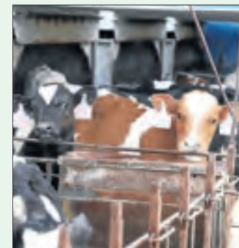
El Segrià, punter.

costos, dignificar la imatge, reduir l'impacte ambiental i recuperar el consum interior.