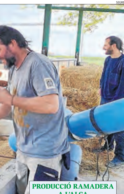
PRODUCCIÓ RAMADERA A L'ALÇA