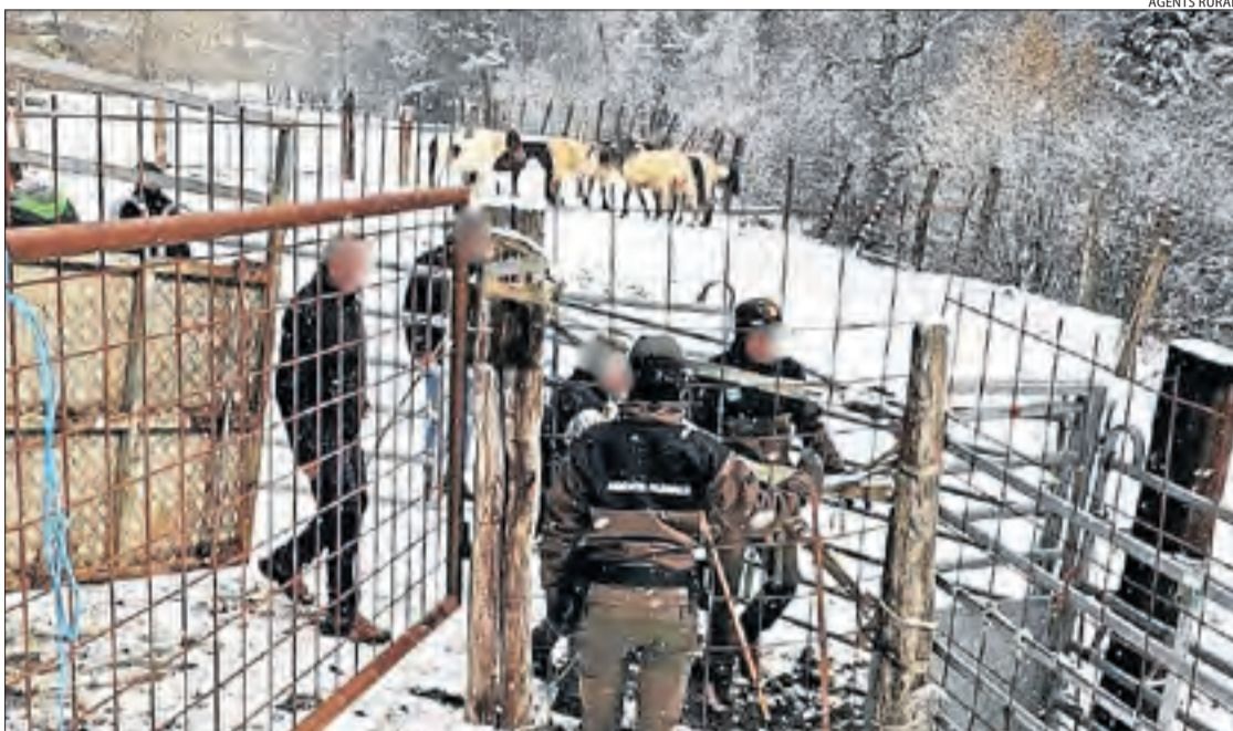
Un moment de la intervenció dels Agents Rurals divendres a la muntanya de Tor.