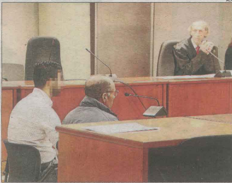
El judici es va celebrar el novembre del 2022 a l'Audiència.

Així, el tribunal considera provat que l'acusat va besar la nena a la boca contra la seua voluntat. La menor va explicar que l'home, conegut de la seua família, li va demanar que li llegís una carta perquè no les entenia, per a la qual cosa li va demanar que entrés en un portal. La nena va relatar que, llavors, el condemnat la va besar a la boca i la va agafar del braç, però que va poder escapar-se i a l'arribar a casa ho va explicar a la seua mare. El Suprem descarta l'allegació del processat que la menor incorregués en contradiccions a l'assenyalar que el