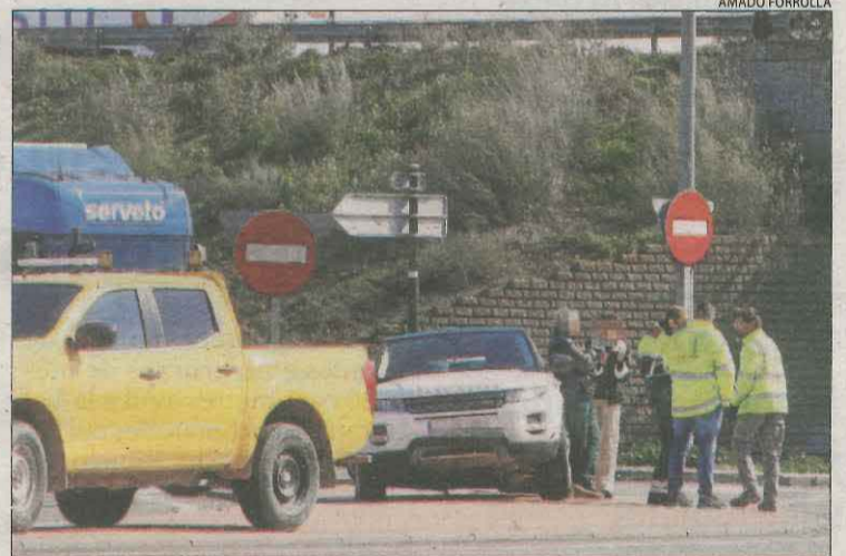
Un dels vehicles implicats en el sinistre.