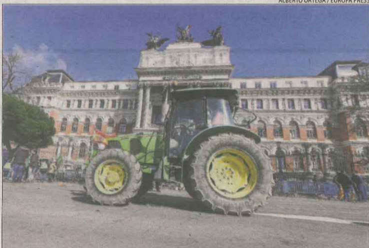
Un tractor parat davant del ministeri d'Agricultura a Madrid.