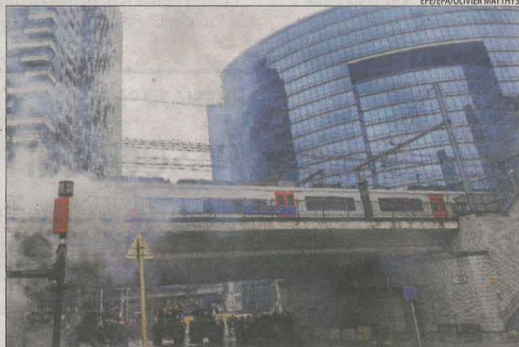
En les mobilitzacions a Brussel·les es van produir alguns incidents.