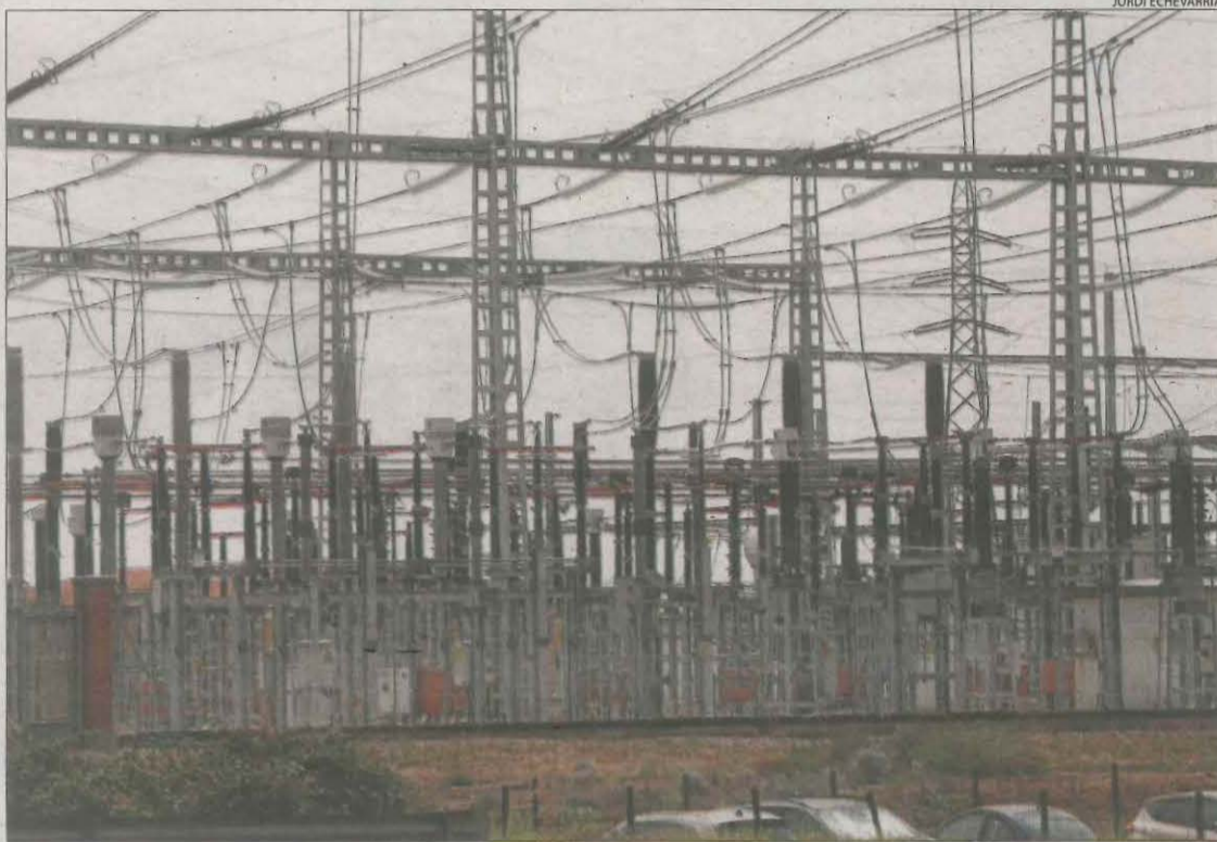
La subestació de Magraners de la qual parteix la línia d'alta tensió de Red Eléctrica de España.

A les comarques lleidatanes travessa els municipis de Lleida i vuit més. El seu pressupost supera els 55 milions d'euros