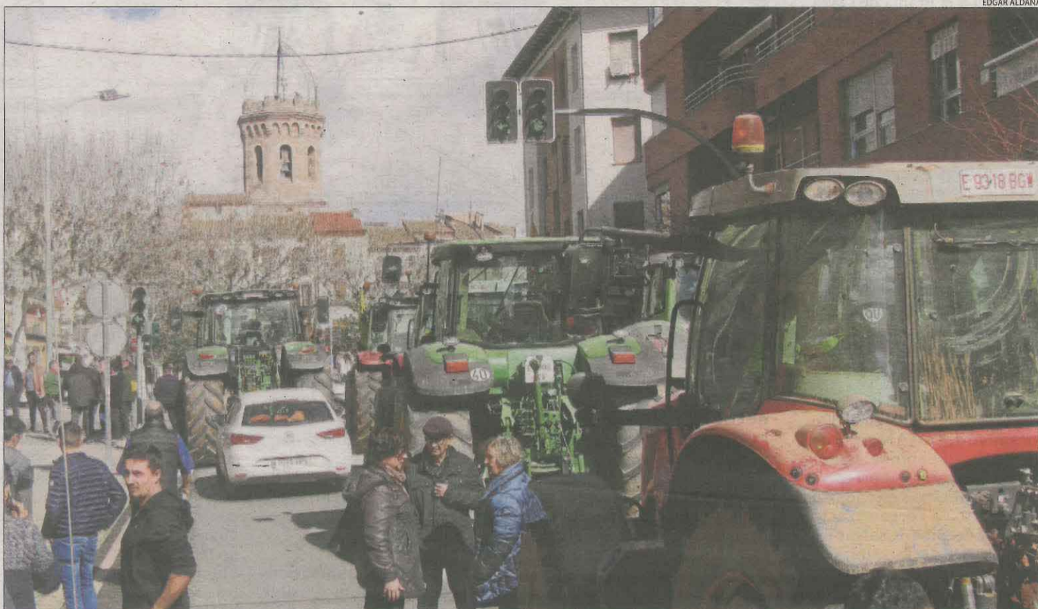
Imatge dels tractors que van sortir a protestar pels carrers de Tremp.

D'altra banda, tant la Plataforma Pagesa com Unió de Pagesos han organitzat una sèrie de mobilitzacions per tot Catalunya, incloent-hi Lleida i passos fronterers amb França. Avui hi ha previstes mobilitzacions a Alcarràs, Alfarràs, Almacelles, el Pont de Suert, Soses, Tàrraga i Bassella.