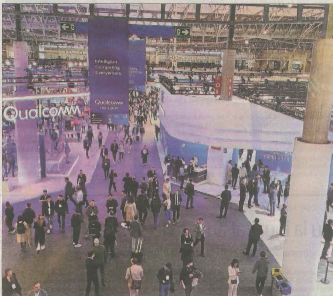
El saló més gran de tecnologia mòbil del món va celebrar ahir la tercera jornada a Barcelona.