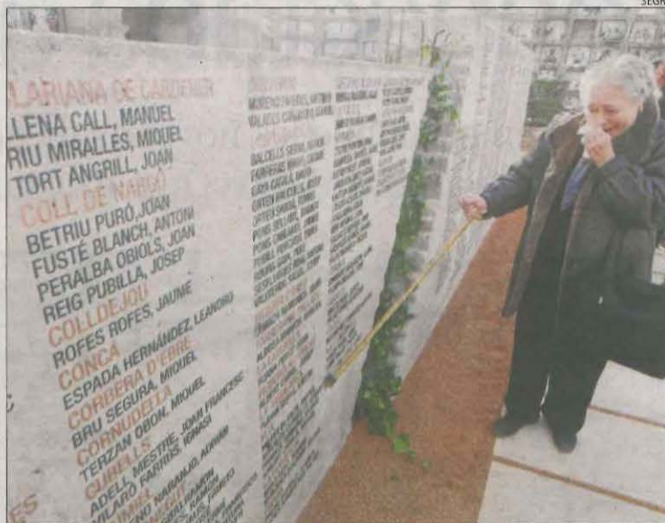
Monument a les víctimes de la guerra al cementiri de Lleida.

“L'objecte d'aquesta actuació no era la repressió massiva de les dones com sí que ho era en el cas dels homes. Encara que tam-