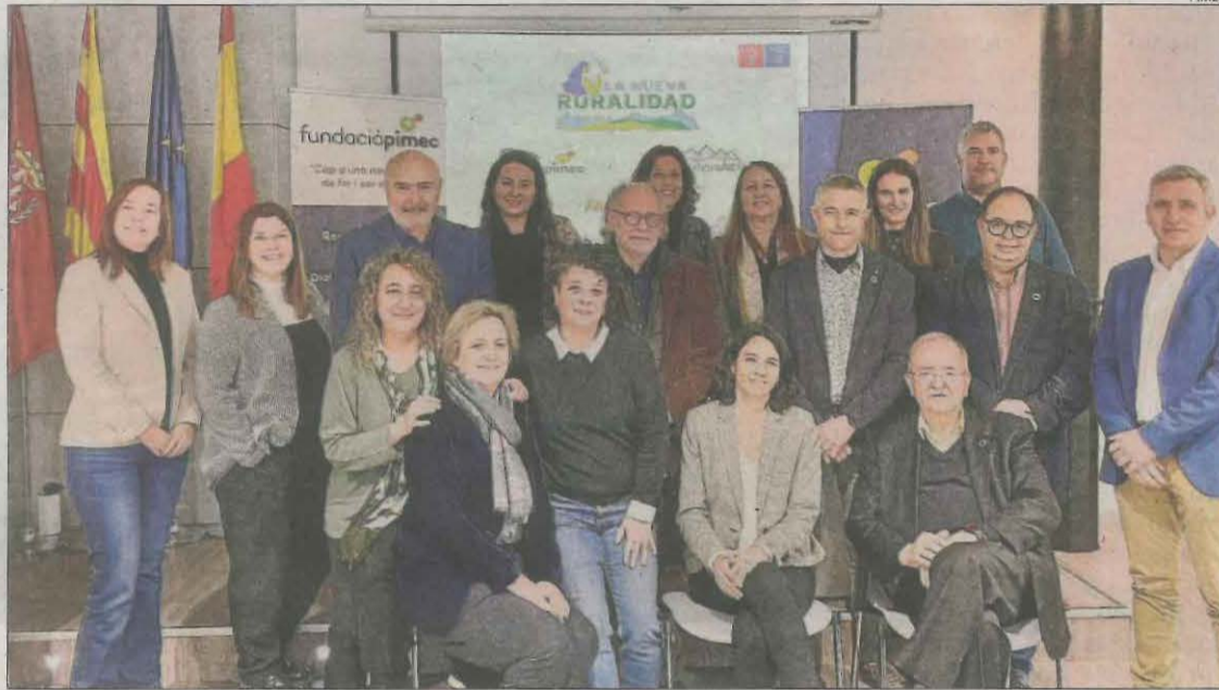
Imatge dels assistents a la reunió entre la Fundació Pimec i les entitats d'empresadores.

Va explicar que la Fundació Pimec, que va nàixer l'any 2007, persegueix activitats socials en relació amb les empreses. Va prendre força amb el seu primer programa, Emppersona , per ajudar les empreses que havien tancat o havien entrat en suspensió de pagaments per la crisi econòmica. Segons va manifestar, "en aquell moment vam ajudar molts empresaris a orientar-se i a tornar a tenir esperit empresarial, el que anomenem una segona oportunitat".