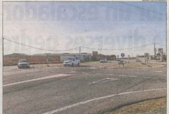
Una de les rotondes partides de l'N-240 a Juneda.