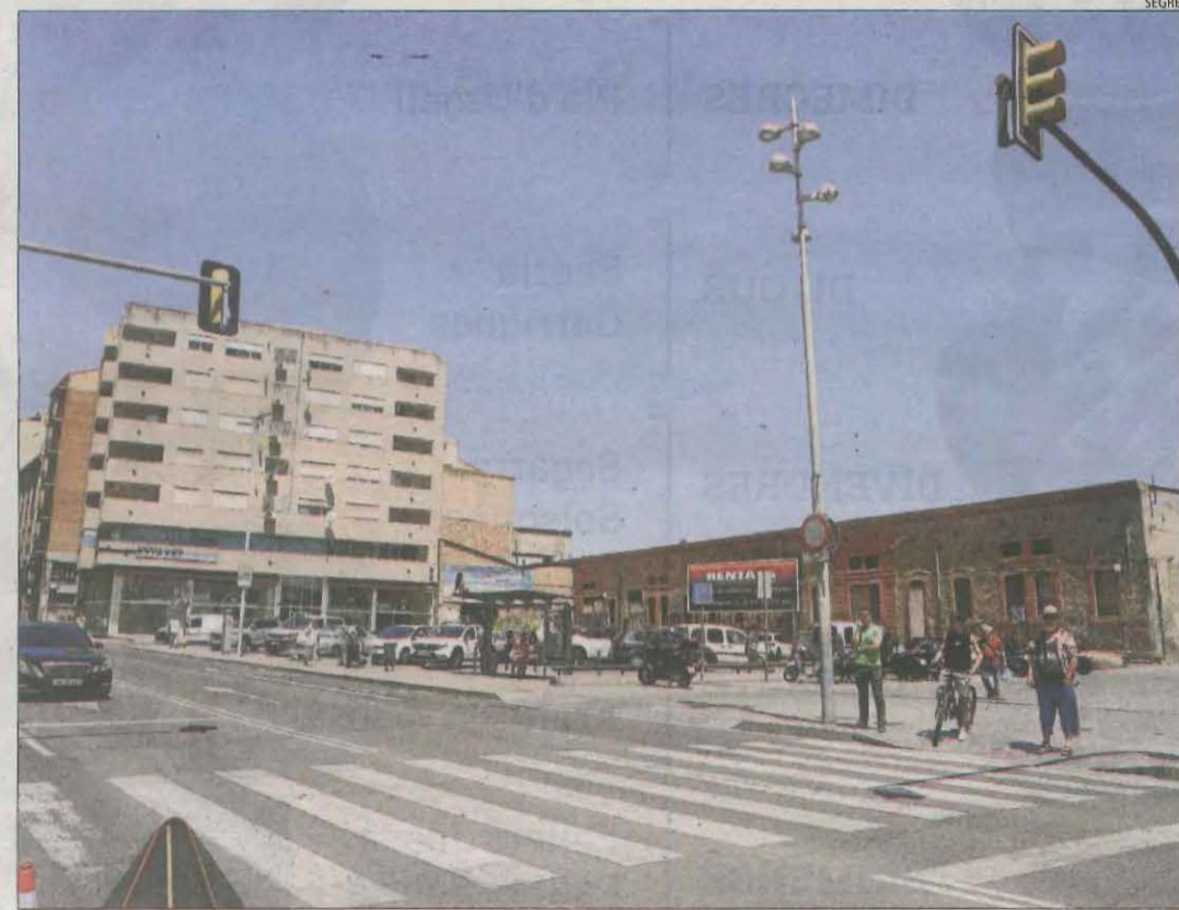
La nova estació d'autobusos de Lleida es preveu a la zona dels Docs i l'entorn de la Meta.

■ La conservació de carreteres té consignats més de 665.617 euros. Al marge de les inversions, el pressupost també contempla una transferència de capital de 580.000 euros per a l'Espitau.