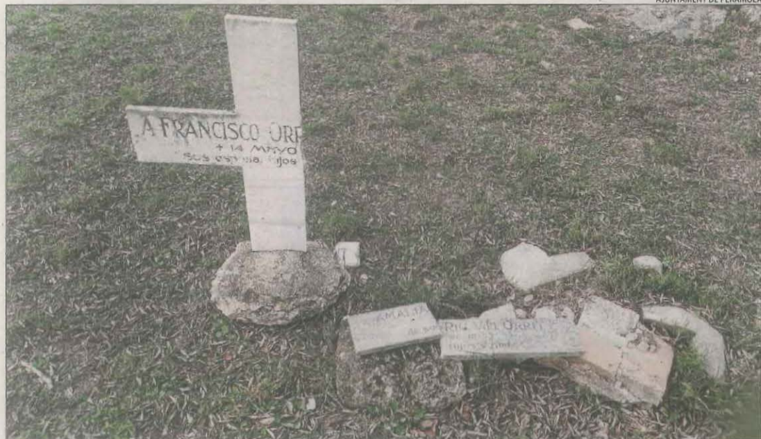
AJUNTAMENT DE PERAMOLA

Almenys 25 exemplars ocasionen desperfectes al municipi || L'ajuntament inicia els tràmits per capturar-les