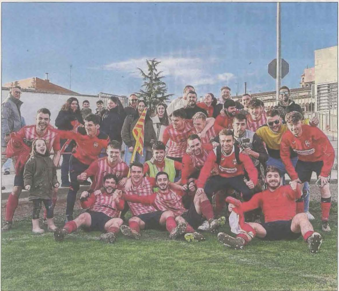
Els jugadors locals van celebrar el triomf amb la seua afició.