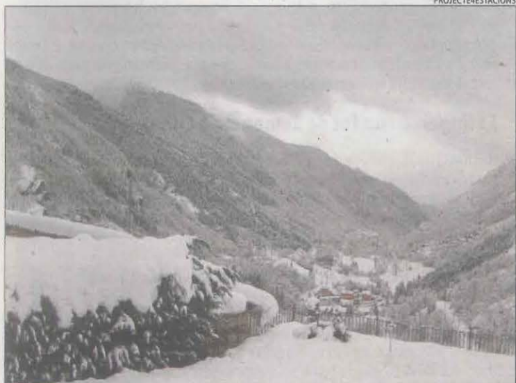
Vista de la nevada des de Capdella.

Durant la jornada d'ahir, les precipitacions van ser més escasses i es van registrar 4,6 litres per metre quadrat a la Gradella, i 3,5 a Seròs. Per avui es preveuen noves nevades a la Val d'Aran i el Sobirà.