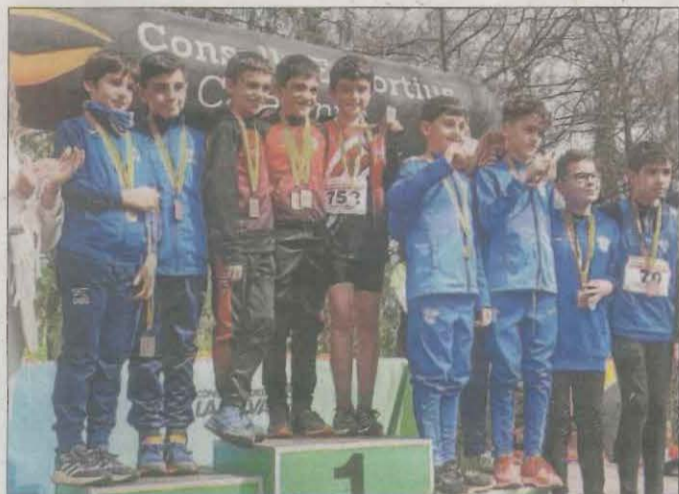
El CA la Pobla va obtenir 13 podis a Santa Coloma de Farners.