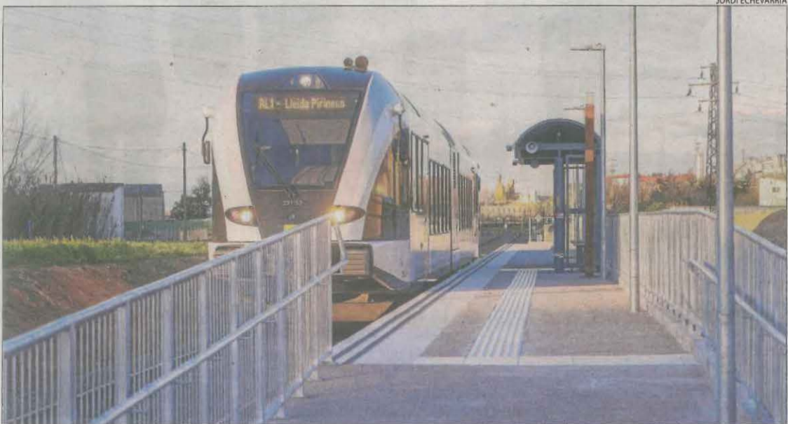
El baixador està ubicat al costat de l'avinguda Indústria i disposa d'un pàrquing de vehicles i bicicletes.

LLEIDA | El Comú va sol·licitar ahir a la Paeria acabar amb l'acumulació de residus durant els mercats de Pardinyes i el Camp d'Esports, i implicar més els comerciants en la neteja. Va instar a iniciar "campanyes de sensibilització i, si procedeix, de sanció".