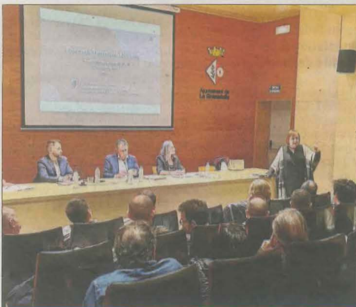
La reunió feta ahir a la nit a la Granadella.

|| LLEIDA | Edils dels ajuntaments del Segrià i les Garrigues que es beneficien del fons de compensació per la nuclear d'Ascó van acudir ahir a una reunió a la Granadella sobre aquests ajuts. La distribució dels diners i les condicions del 2024 s'abordaran en una sessió de l'òrgan de governança el 3 d'abril. La delegada de la Generalitat a Lleida, Montse Bergés, va destacar que és "una gran oportunitat" per als pobles.