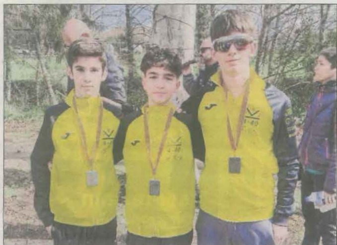
El club Tri-440 va aconseguir un segon lloc per equips.