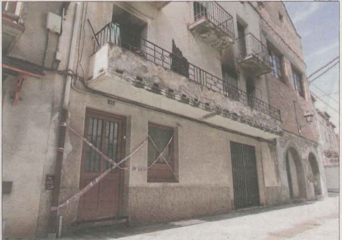
L'habitatge afectat per l'incendi es troba al carrer Oran de la Pobla de Segur.

Els Mossos d'Esquadra s'han fet càrrec de la investigació per aclarir les causes de l'incendi i de les tasques judicials pertinents. Així mateix, a l'inte-