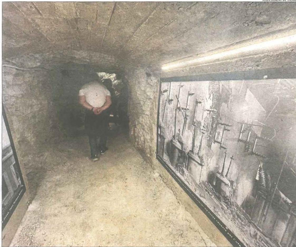
Plafons amb imatges i textos en una galeria del refugi antiaeri.