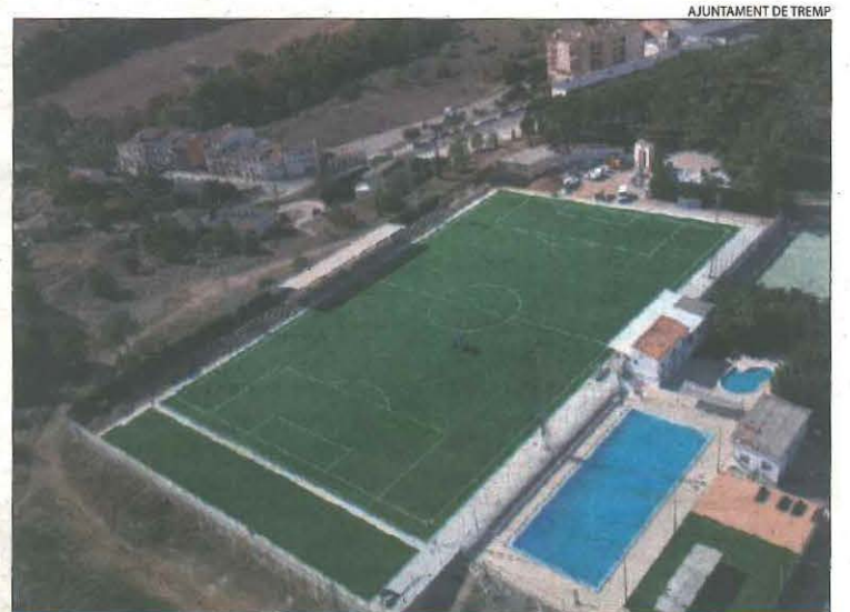
Imatge aèria de la zona esportiva del Pinell de Tremp.

La previsió de l'ajuntament és finalitzar aquesta actuació abans que acabi l'any 2025.