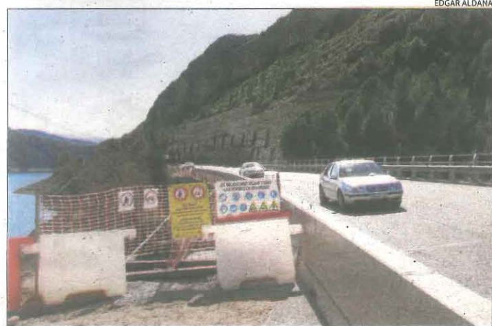
El tram en obres, ahir sense el semàfor que provocava queixes.