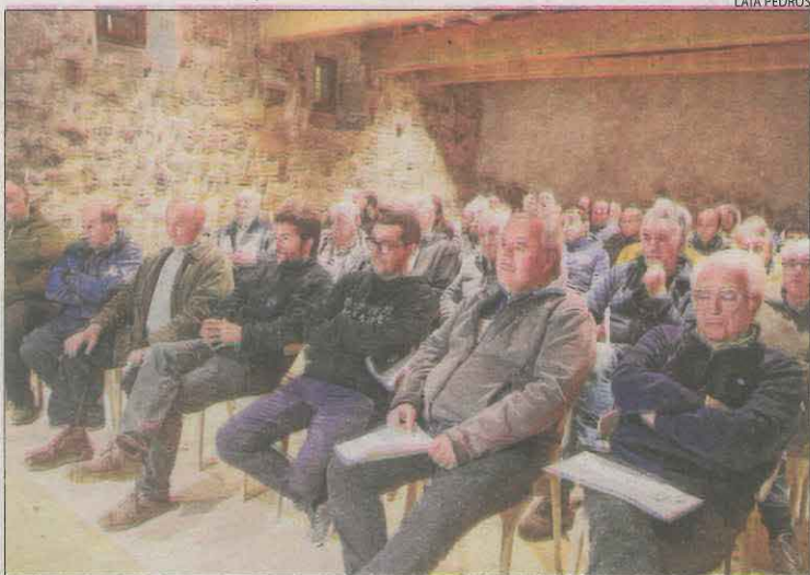
L'assemblea celebrada divendres a Anglesola.

Al ser regadius històrics i afectats per una zona d'especial protecció d'aus (zeпа), està previst redactar un protocol de reg amb la Generalitat. Ara per ara seguiran regant a manta fins que s'instal·lin nous hidrants, una actuació que es preveu en el protocol per modernitzar el reg com ho està el Segarra-Garrigues. Per poder continuar regant tant a Anglesola com a Belianes, eren neces-