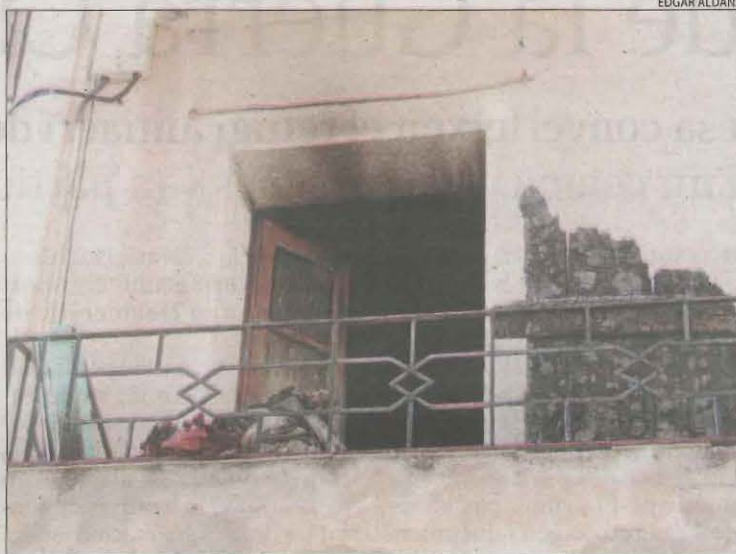
El foc es va iniciar a la primera planta de la casa.

rior de l'habitatge es trobaven en aquell moment animals de la víctima.