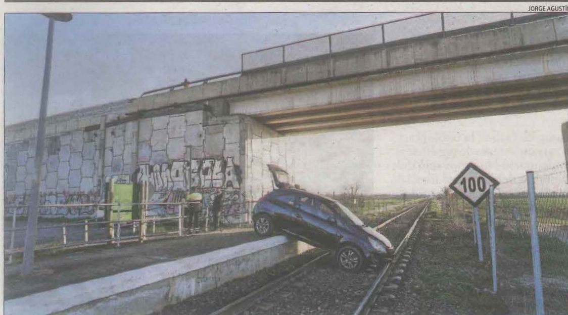
El cotxe va quedar enmig de la via del tren a Alcoletge i va afectar la circulació entre Lleida i Balaguer.

El juny de l'any passat, una dona va morir després d'un incendi en un bloc de pisos de Balaguer al caure al buit des d'una finestra. Els Bombers van dur a terme el 2023 una mitjana de vuit sortides a la setmana per incendis en edificis a la demarcació. En total, es van comptabilitzar 443 serveis per focs a immobles.