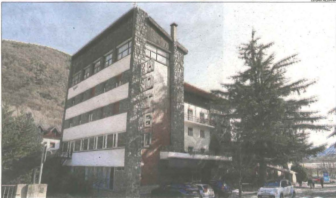
L'hotel Condes del Pallars, al municipi de Rialp.

L'hotel Condes del Pallars s'ha especialitzat, amb l'actual empresa gestora, a acollir grups d'estudiants i de colònies i afronta cada any, especialment durant els mesos d'estiu, compromisos de gran envergadura com el d'allotjar els alumnes del