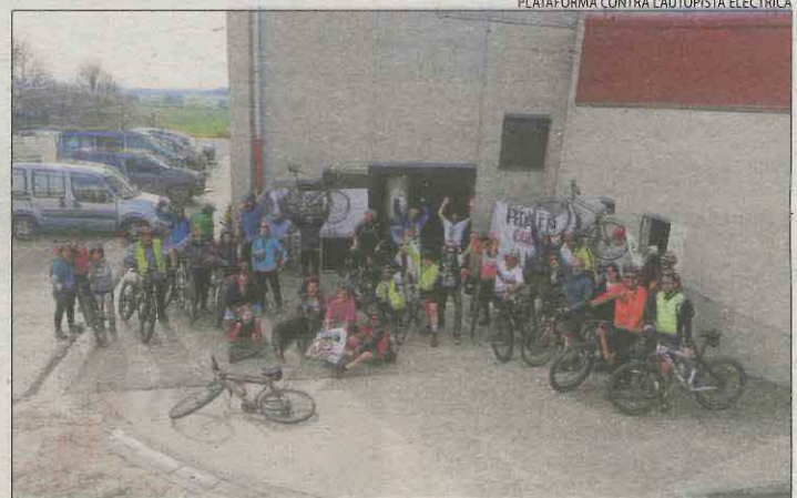
Marxa ciclista contra les MAT ■ Al voltant d'una trentena de persones participen en una marxa ciclista de 130 quilòmetres que va partir ahir de Lluçanès (Osca) i finalitza avui a Isona per protestar contra noves línies de molt alta tensió (MAT).

rogat són algunes possibilitats per corregir aquesta situació. A Lleida ciutat, es considera que les obres de la nova estació d'autobusos no es veuran compromeses pel rebuig dels pressupostos de la Generalitat, a causa que el seu finançament procedeix de fons europeus. Aquesta dotació es podria moure a una altra partida pressupostària per no perdre-la.