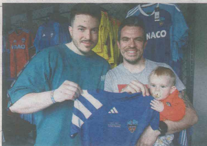
La samarreta commemorativa

La prenda, amb un embalatge especial, és blava amb tres franges blanques a l'espatlla dreta i una inscripció al pit que recorda l'efemèride: els 30 anys de l'ascens a Primera. P.25