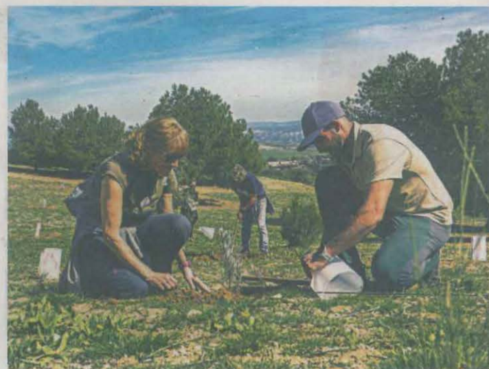
Diversos veïns planten arbres

Així, amb aquesta protecció s'evita, entre altres coses, que aquest arbre centenari sigui tallat, arrencat o malmès.