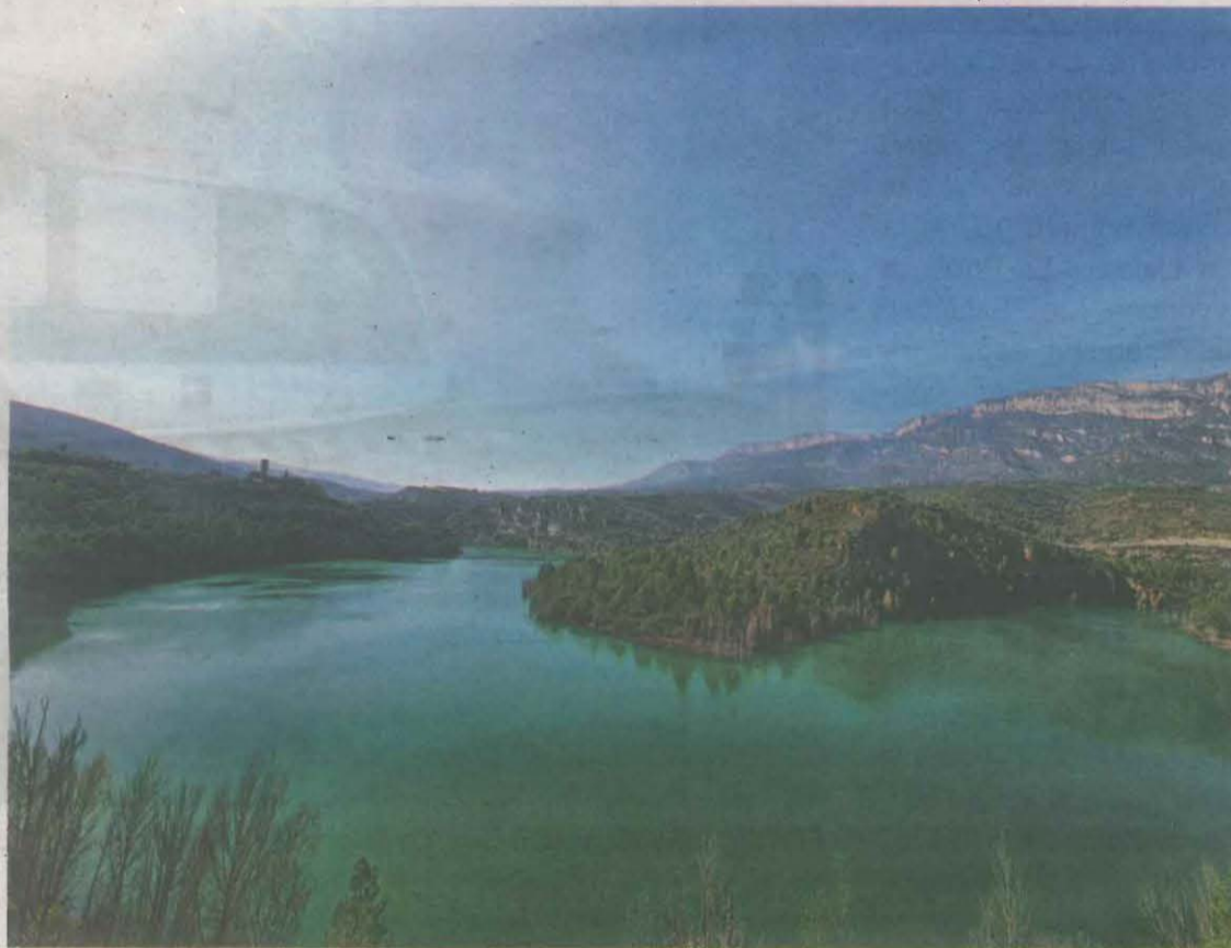
Imatge del pantà de Camarasa, que es troba al 92% de la seva capacitat

Pel que fa als pantans de la Noguera Ribagorçana, l'augment en aquest últim any també és notori i, entre Escales, Canelles i Santa Ana, han guanyat 90,34 hectòmetres, fet que permet assegurar la nova campanya. Segons les da-