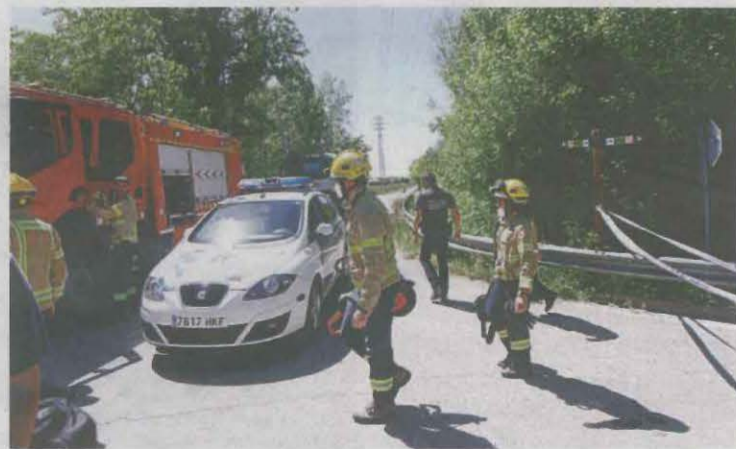
Els bombers van haver d'apagar ahir un altre foc, al Parc de la Mitjana de Lleida