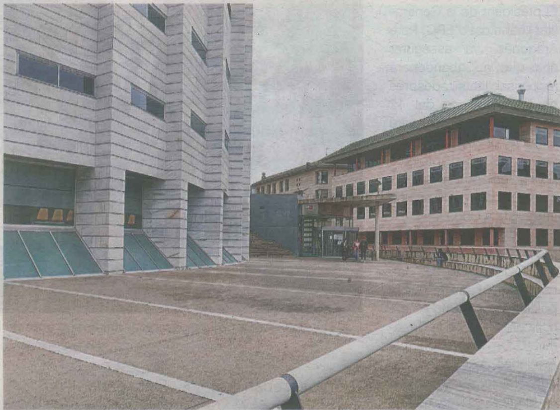
El judici se celebrarà el dimecres i el dijous de la pròxima setmana

Segons el ministeri fiscal, un dels acusats va llogar la nau el 2015 i entre tots quatre van manipular