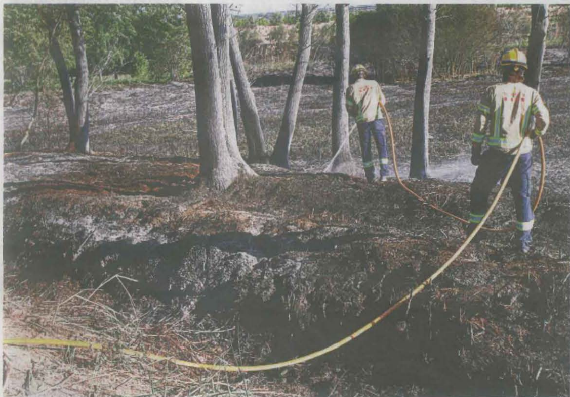
La zona de l'incendi va ser revisada ahir pels bombers

Petició de vuit anys per tràfic de drogues a Torregrossa _P.17