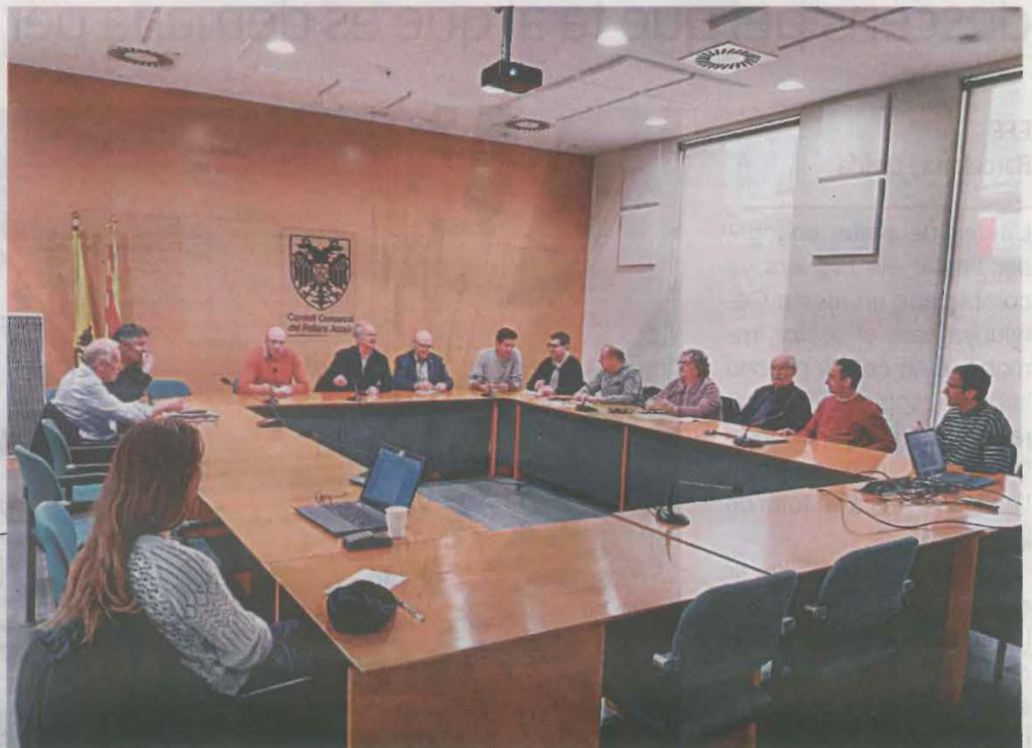
Reunió entre alcaldes del Pallars Jussà i el Govern el passat 3 d'abril