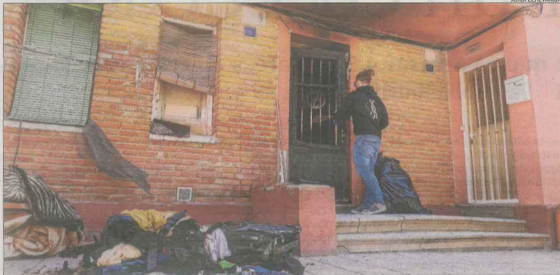
Imatge ahir al matí de l'exterior del pis del carrer dels Plans.

guts, respectivament. El jutjat de guàrdia de Lleida va enviar a presó dos dels arrestats a Torrebbesses. En aquest cas, la plantació estava en una granja en desús i tenia la llum punxada d'una torre de mitjana tensió. Els arrestats a Artesa van quedar en llibertat.