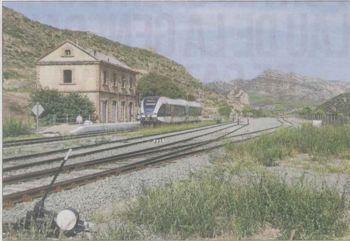
L'estació de tren de Sant Llorenç de Montgai, que acollirà un espai didàctic.

Per la seua part, l'ajuntament de Castell de Mur també ha mo-