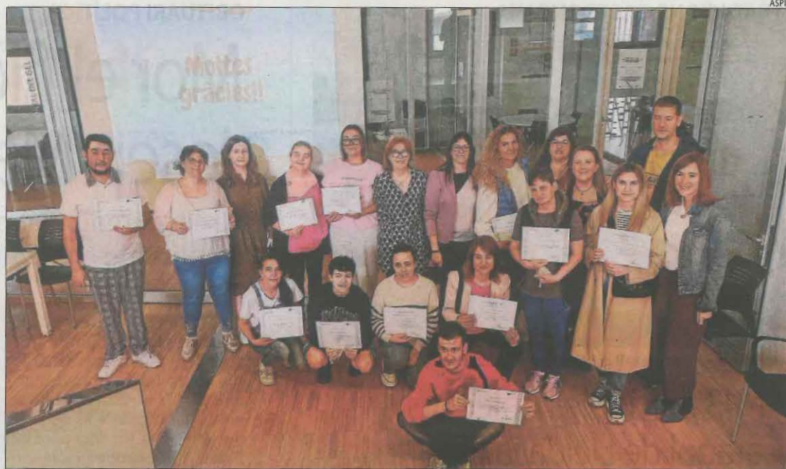
Entrega de diplomes del curs de Comerç i Atenció al Client organitzat per Aspid.

La Universitat de Lleida organitza durant aquesta setmana la novena edició de la Setmana de les Lletres Hispàniques amb temes com la divulgació cultural a les xarxes socials, la creació literària o les llengües estrangeres.