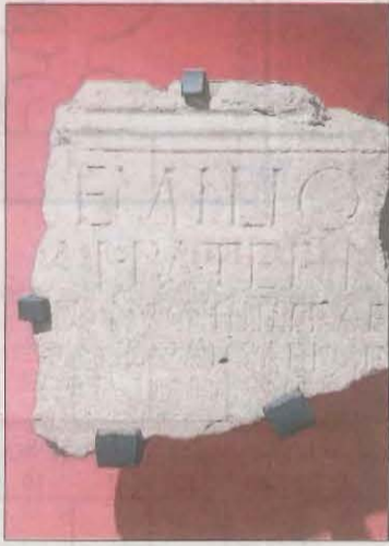
Inscripció romana pallaresa.

participar en les dos guerres de Dàcia (a l'actual Romania) entre els anys 101 i 104, i a la Partia (actual Iran), el 115. Va ser condecorat en tres ocasions amb cadenes i un braçalet d'or per l'emperador Trajà pel seu gran valor i fidelitat demostrats a les seues accions.