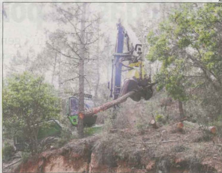
Treballs de tala d'un pi mort.

Compta amb el suport dels Agents Rurals i fa un seguiment dels episodis de sequera als boscos catalans amb l'objectiu d'obtenir sèries llargues sobre la seua evolució. De fet, la meitat dels boscos afectats són masses forestals que ja havien patit el 2022 i és que, en un 60% dels casos, aquests boscos han mostrat un empitjorament