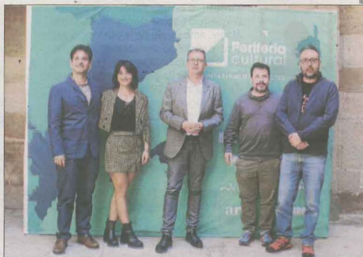
Presentació ahir a l'IEI de la nova edició del Perifèria Cultural.

Talarn va recordar que "la cultura també és un dret" i va felicitar aquesta iniciativa "amb visió de territori, pensada sobretot per a les persones que hi viuen i no només per als que el visiten". Així, el Perifèria Cultural ha programat cites a partir del 15 de juny i fins al