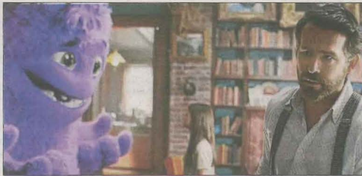
Ryan Reynolds, un dels protagonistes d'Amigos imaginarios.

tagonista és una adolescent que té la qualitat de veure i dialogar amb aquests éssers fantàstics, posada al costat d'un adult que guarda una sorpresa en la seua història -paper a càrrec de Ryan Reynolds en un treball purament alimentari- en la recerca d'aquelles persones que