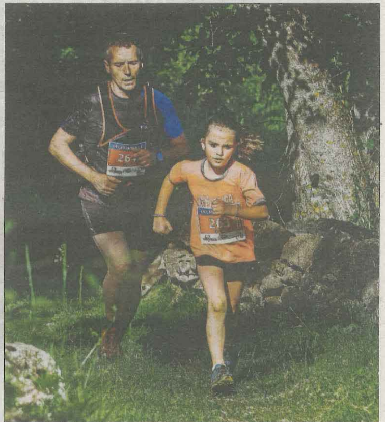
Dos dels participants en la prova d'ahir.

Quant a la distància d'11 km, els guanyadors van ser dos atle-