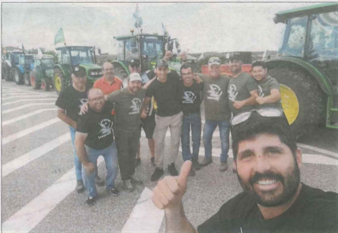
Els agricultors es van concentrar ahir amb els tractors a Oliana per sortir avui cap a la Seu d'Urgell.

A Lleida, la tractorada no ha reunit el quòrum multitudinari de les anteriors convocatòries, amb Revolta Pagesa i Asaja com