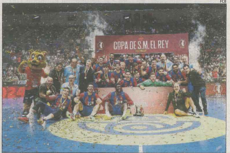
L'equip blaugrana posa amb la copa conquerida a Jaén.