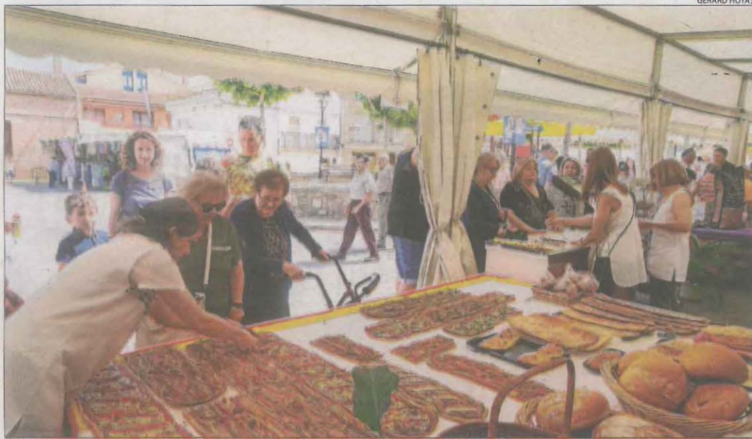
Visitants comprant ahir al matí en una de les parades de FiraBell a Bellcaire d'Urgell.

Amb tastos i un mercat amb més de 70 parades || L'organització estima que unes 3.000 persones han visitat el certamen