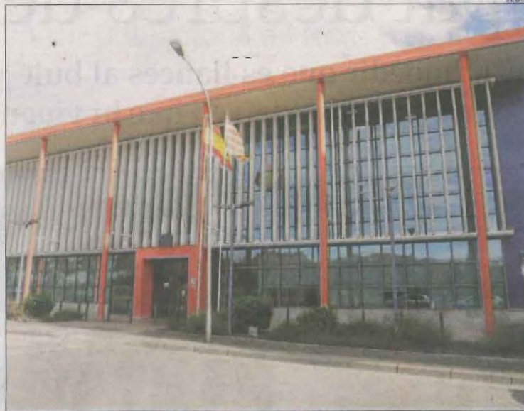
Imatge de la comissaria dels Mossos d'Esquadra.