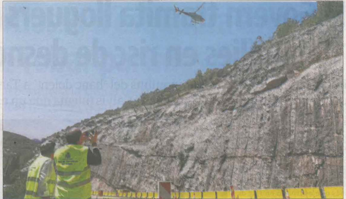
L'helicòpter va estar traslladant material durant 45 minuts fins a dalt de la muntanya.