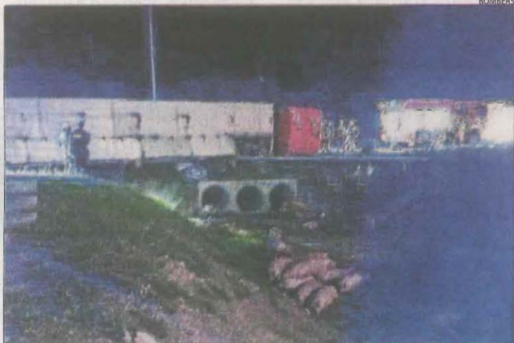
Imatge del camió de porcs bolcat a la C-14 a Tàrraga.

| LLEIDA | Diverses persones van resultar ferides en cinc accidents de trànsit que es van registrar entre dimarts a la nit i ahir a les carreteres del pla de Lleida. El primer va tenir lloc a les 23.26 hores de dimarts a la C-14 a Tàrraga al bolcar lateralment un camió que transportava porcs. El conductor, que va resultar ferit lleu, va quedar atrapat mecànicament i va haver de ser rescatat pels Bombers. Posteriorment, es va fer el traspàs dels animals vius a un altre camió. Dos persones més van resultar ferides lleus en una col·lisió que hi va haver ahir al migdia a la carretera C-13 al seu pas per Balaguer, segons van informar els Bombers, que hi van acudir amb dos dotacions. Posteriorment, a les 14.32 hores un turisme va bolcar a la carretera C-26 al seu pas per Camarasa. Una persona