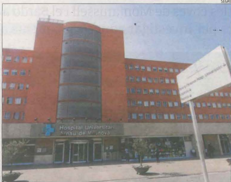
Vista de l'Hospital Arnau de Vilanova de Lleida.

A diferència dels òrgans, on el temps és crucial, els teixits donats es processen i s'emmagatzemen per ser distribuïts segons la necessitat. És el Banc de Sang i Teixits el que s'encarrega de manipular-los, preparar-los i fer arribar-los als hospitals. En el cas dels trasplantaments de còrnia, per exemple, és l'única alternativa que tenen alguns