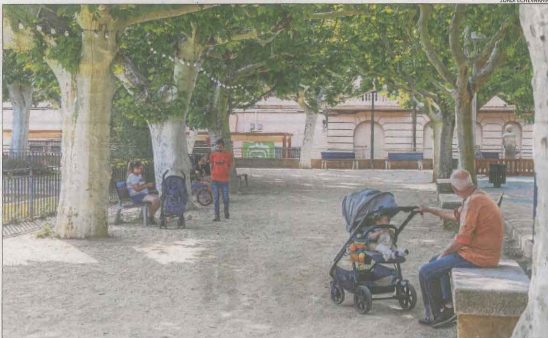
Veïns protegint-se del sol ahir a les Borges Blanques, on es van assolir els 33,2 graus.

LEIDA | Ponent experimenta aquests dies un avançament de l'estiu, amb temperatures que poden superar demà i dissabte els 36 graus. Els termòmetres van començar a pujar ahir a les comarques lleidatanes, on es van registrar els valors més alts de tot Catalunya. Segons les dades del Meteocat, l'estació meteorològica de Torres de Segre va assolir una màxima de 34,8°. El van seguir de prop Alfarràs i Alcarràs (34,7°), encara que Castellnou de Seana, el Poal, els Alamús, Lleida, Gimènells i Vilanova del Segrià també van registrar temperatures per sobre dels 34 graus.