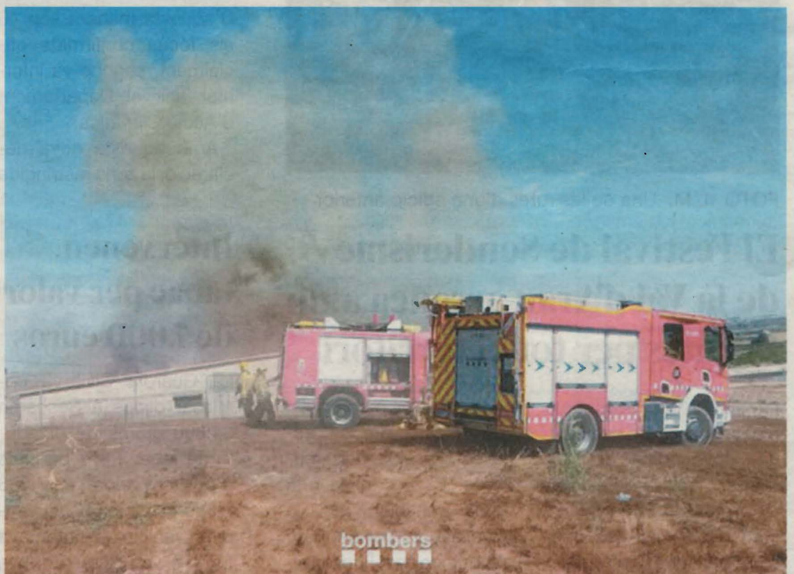
FOTO_Bombers Moment en què els efectius del cos de Bombers de la Generalitat treballaven a la granja afectada per l'incendi

D'altra banda, un foc cremar una petita superfície de rostolls al terme d'Almacelles, concretament al Camí de la Saira. A més, un vehicle va quedar ahir calcinat i les flames van afectar la vegetació a l'A-2, a Alcoletge.