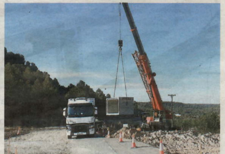
La Diputació de Lleida disposa de 97,4 quilòmetres de carreteres a la comarca

L'entitat afegia en el seu document que "el risc principal per a aquestes àguiles, la cuabarrada en risc d'extinció i la daurada gairebé en risc, són els cables d'alta tensió, que de fet seguen la vida d'entre 300 i 400 àguiles a l'any. Lleida és la demarcació catalana on més aus moren per aquesta raó".