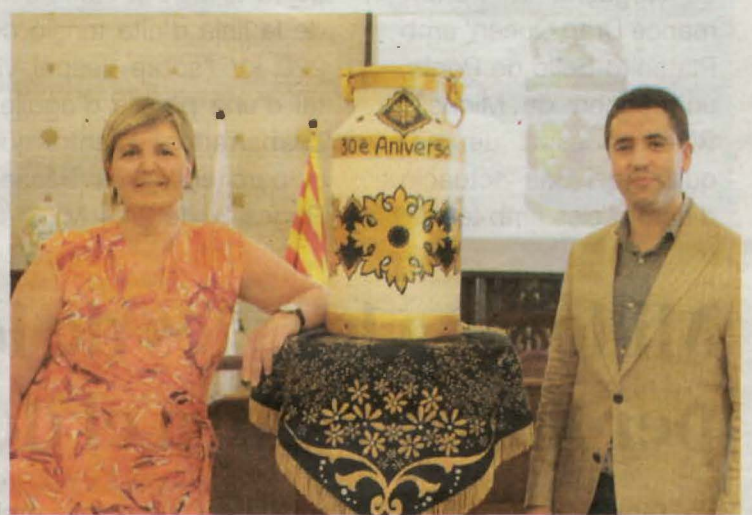
El consistori va presentar ahir el cartell

Lleida, Solés Carabassa, va inaugurar les jornades i va destacar el valor afegit que tenen pel Montsec.