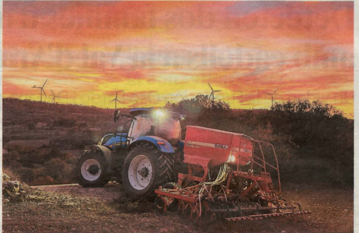
FOTO_UP Imatge de Xavier Nadal sembrant a l'Alta Segarra amb el cel ben encès

la consolidació de l'estructura de diversos elements amb l'objectiu d'evitar-ne el col·lapse i protegir-los de l'efecte dels agents atmosfèrics. El monestir es va construir a principis del segle XIII i es pot visitar els primers i tercers caps de setmana de cada mes en horari de matins.