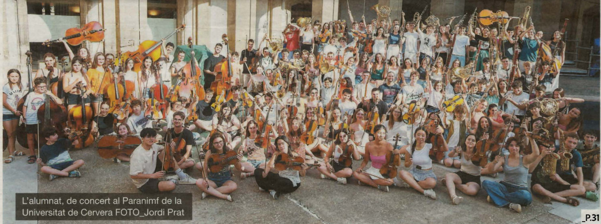
L'alumnat, de concert al Paranimf de la Universitat de Cervera