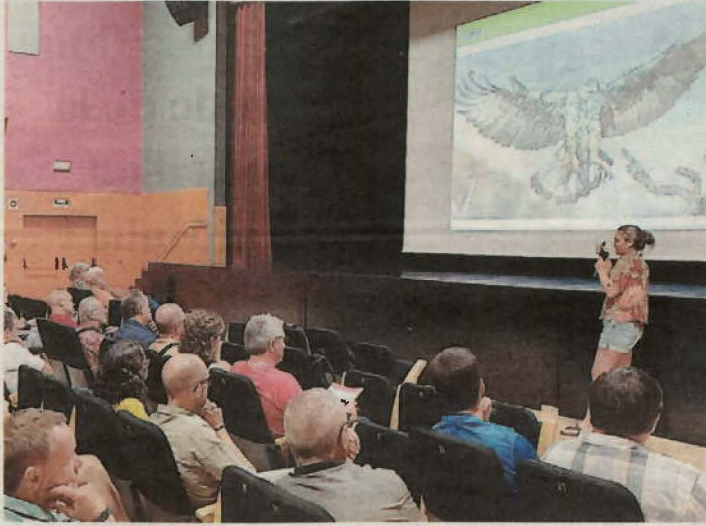
FOTO_ C.C.N. Artesa de Segre va acollir la primera reunió amb la participació de més de 50 persones