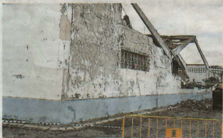
Estat en què va quedar la nau del polígon industrial Revés d'Alcarràs arran de l'esclafit