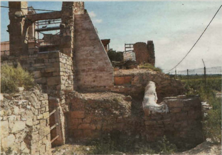
S'han consolidat aquells elements arquitectònics que patien diferents patologies

Els equips tècnics dels Consells Comarcals del Pallars Jussà i de la Noguera han començat aquesta setmana les sessions informatives sobre el projecte del Parc Natural del Montsec. En la primera, celebrada a Artesa de Segre, van assistir més de 50 persones dels sectors de l'hostaleria, agricultura o la caça provinents d'Alòs de Balaguer, Artesa de Segre i Vilanova de Meià. Les reunions es continuaran programant en les pròximes setmanes i l'objectiu és copsar i valorar les diferents visions del territori per iniciar els processos d'estudi i viabilitat del parc.