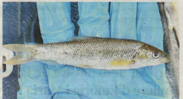
Imatge d'un dels peixos que els efectius del cos van trobar morts per l'abocament

les primeres investigacions, treballen amb la hipòtesi d'un vessament d'una bassa de purins d'una granja de porc. La investigació continua oberta i durant els pròxims dies faran seguiment de les afectacions al medi ambient. De fet, també s'ha de determinar si els fets poden ser constitutius d'un delictes contra el medi ambient.