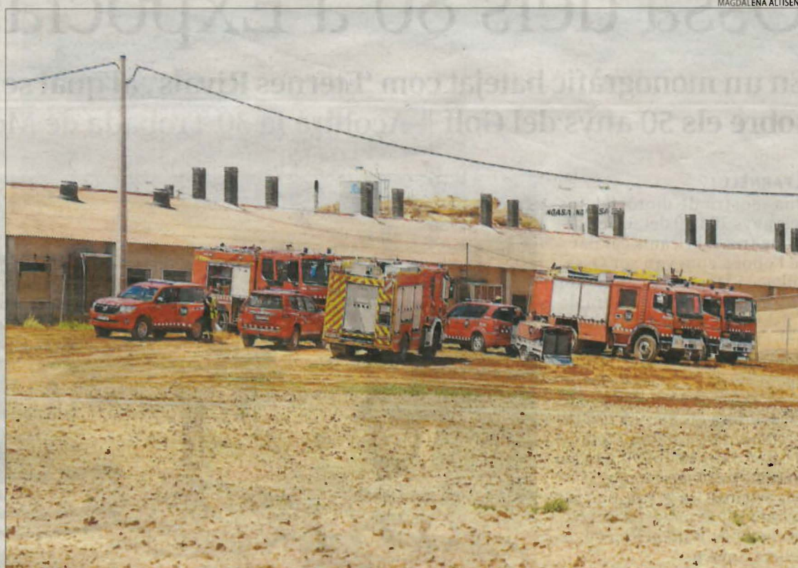
En l'extinció van participar dotze dotacions.

Una furgoneta va cremar a l'A-2 a Alcoletge i les flames es van propagar a una zona de vegetació