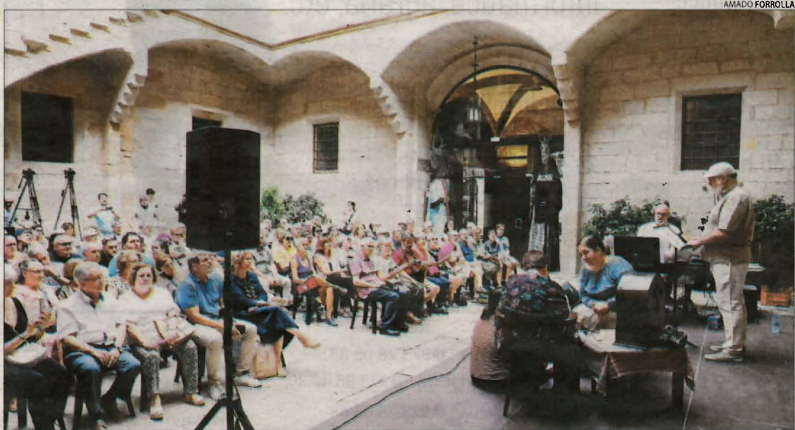
Tres integrants de la companyia de teatre La Màxima van representar les recitacions de Jaume Belló.

passat i diumenge– i arribarà divendres a Bescaran, a l'Alt Urgell, instal·lant la carpa just darrere del restaurant La Canal. Aquest "últim somni" professional de la troupe de Tortell Poltrona continuarà de gira transpirinenca del 19 al 21 de juliol a Lles de Cerdanya abans de saltar al Pirineu gironí.