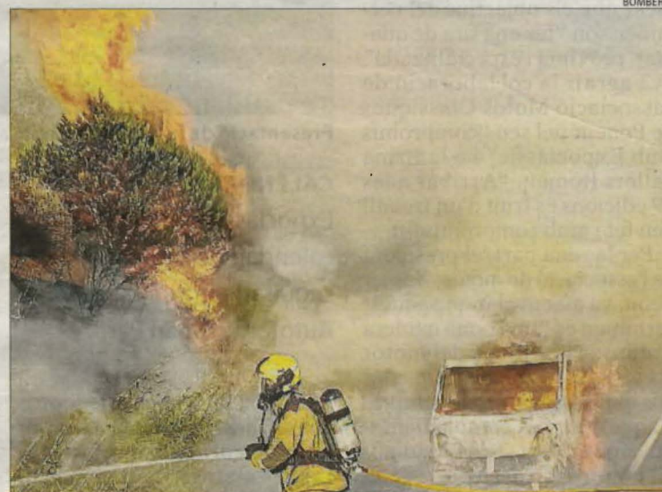
Imatge del foc a Alcoletge.

Per un altre costat, el risc d'incendi s'incrementarà notablement aquests propers dies per l'augment de les temperatures, ja que es preveu que alguns punts de Ponent puguin atansar-se als 40 graus. Pel que fa al pla Alfa, hi ha tres comarques que es troben avui dimecres en el nivell 2 sobre quatre (la Segarra, l'Urgell i les Garrigues).