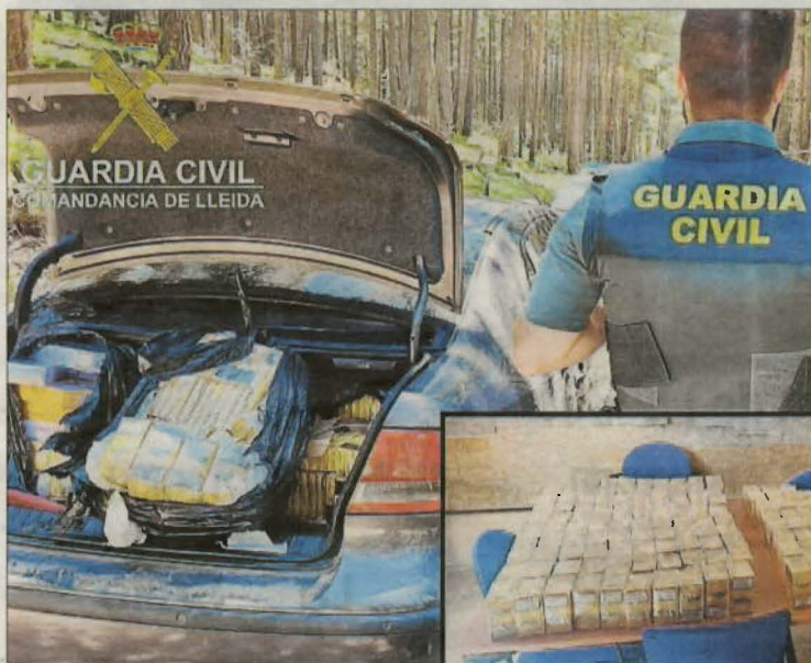
Imatge del tabac decomissat.