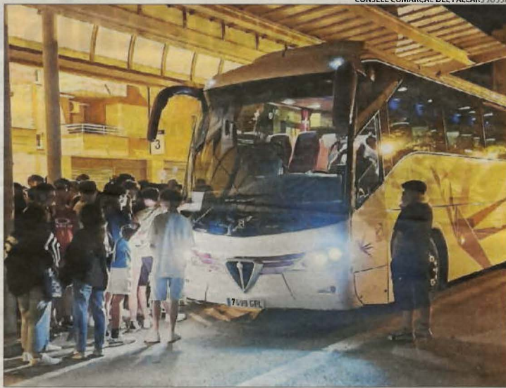
Imatge d'arxiu del Bus de la Festa.