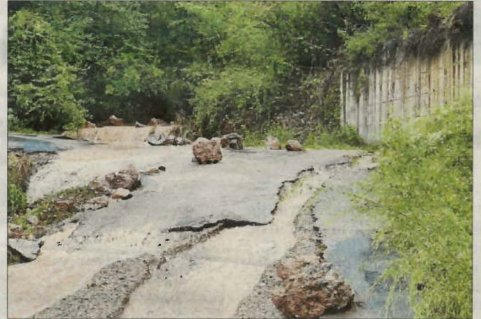
L'accés al poble de Sarroqueta, al Pont de Suert.

EL PONT DE SUERT | Els equips tècnics del consell comarcal de l'Alta Ribagorça portaran a terme un estudi per quantificar els danys ocasionats per les pluges torrencials de dissabte passat. Les zones més afectades corresponen al municipi del Pont de Suert entre els nuclis de Castelló de Tor, Sarroqueta i Llesp, els accessos del qual es van reobrir dilluns, mentre que es va restablir l'aigua de boca de les Bordes i Malpàs.