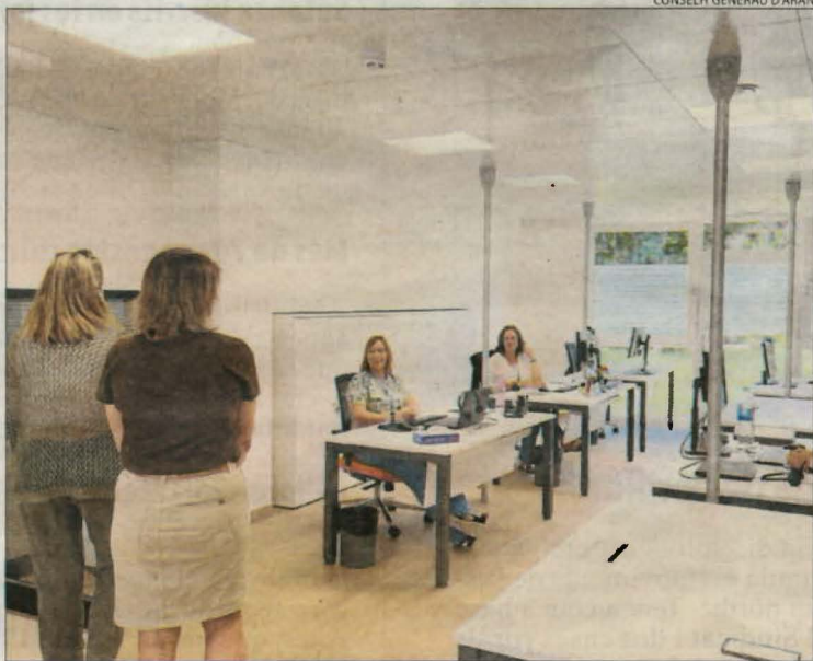
La nova seu dels Serveis Assistencials Integrals del Conselh.