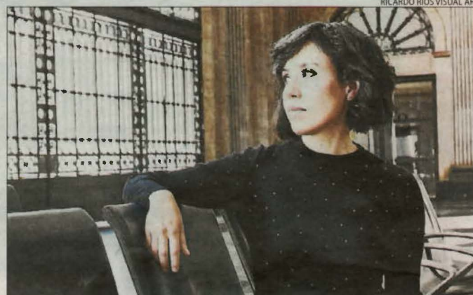
RICARDO RIOS VISUAL ART

Castellserà celebra la festa major amb un programa ple d'activitats per a tots els públics. Per avui està prevista una sopar popular i una cantada d'havaneres a la plaça del Sitjar (21.00 h). El programa complet, a castellsera.cat .