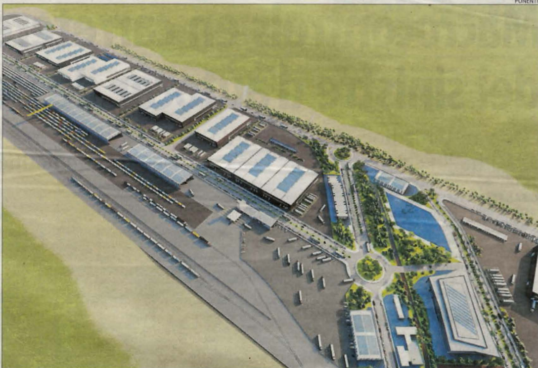
Recreació virtual de les instal·lacions del port sec que promou Ponentia Logístics a Tamarit.