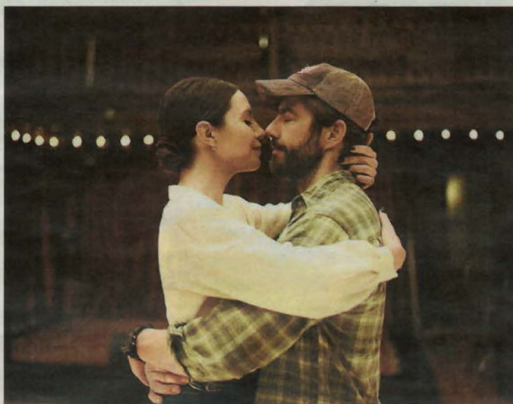
Un fotograma de la pel·lícula 'Simple como Sylvain'.

Sophie fa classes a gent sènior a la universitat sobre filosofia. De per si, en alguns moments i a les seues classes, llisquen profunds pensaments de grans filòsofs sobre l'amor i el desig, així com raonaments entorn d'aquest complex tema. Viu tranquil·la i acostumada a la seua parella, un home del seu mateix nivell, sense sobresalts, i en certa manera adormida, però