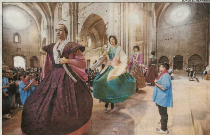
Els Amics de la Seu Vella organitzen la festa del monument.

En aquesta llista pública de Política Lingüística continuen inscrites d'anys anteriors nou entitats lleidatanes: l'Associació Cultural Recreativa Festa, Gastronomia i Cultura d'Agramunt i Comarca, l'Asso-