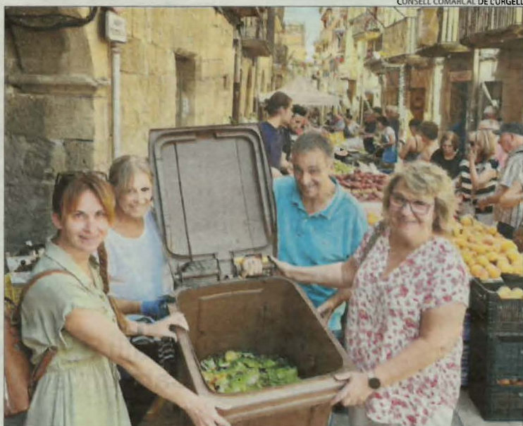
Paradistes, ahir mostrant un dels contenidors.

BALAGUER | La Paeria de Balaguer ha tret a licitació per 150.824 euros la reforma del sistema de climatització del Casal Lapallavacara. Se substituirà l'actual sistema de producció de fred per una planta que refredarà l'aire i l'aigua, i el subministrament d'una bomba de calor reversible. També es preveu sanejar les instal·lacions i que es modifiquin alguns dels conductes.