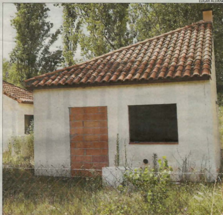
L'ajuntament va tapiar bungalows però tot així en van okupar alguns.