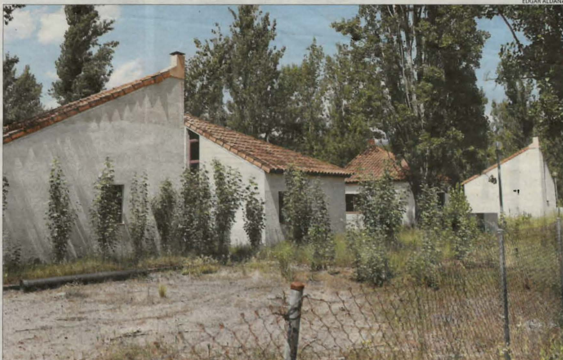
Vista general dels bungalows a l'antiga àrea vacacional de la Pobla de Segur.

Judici al setembre per desnonar-los, com a pas previ a recuperar-ne l'ús turístic i allotjar-hi estudiants || Alumnes d'una nova FP reformaran els més grans i la resta se substituiran amb prefabricats