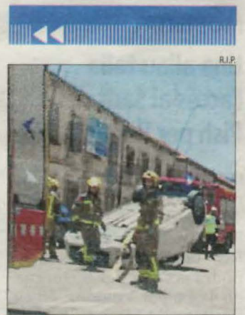
Imatge del sinistre.

■ Un altre dels acords entre les dos administracions és la condonació de 15.000 milions de deute de Catalunya amb mecanismes estatals de provisió de liquiditat com el Fons de Liquiditat Autòmic (FLA). Es farà efectiu en els propers mesos, i permetrà reduir el passiu de la Generalitat, que ara ascendeix a 87.253 milions.