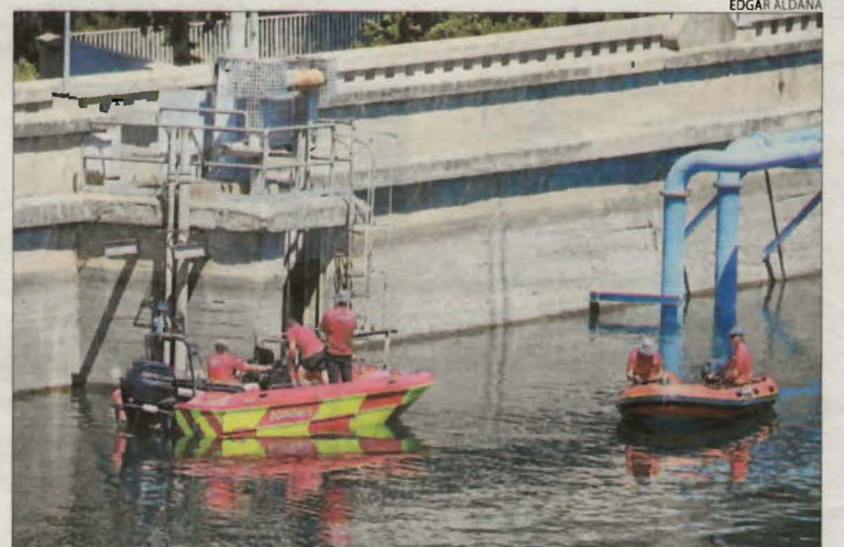
Efectius dels Bombers, ahir a la zona de la presa.

Així, les particularitats del funcionament de l'embassament condicionen també les tasques dels efectius de rescat. S'han de tancar les turbines de la presa per permetre immersions amb seguretat però alhora Endesa, que explota la infra-