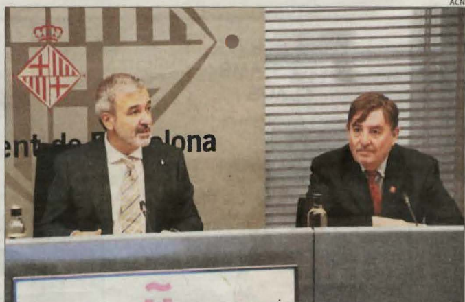
Jaume Collboni i Luis García Montero, ahir a Barcelona.