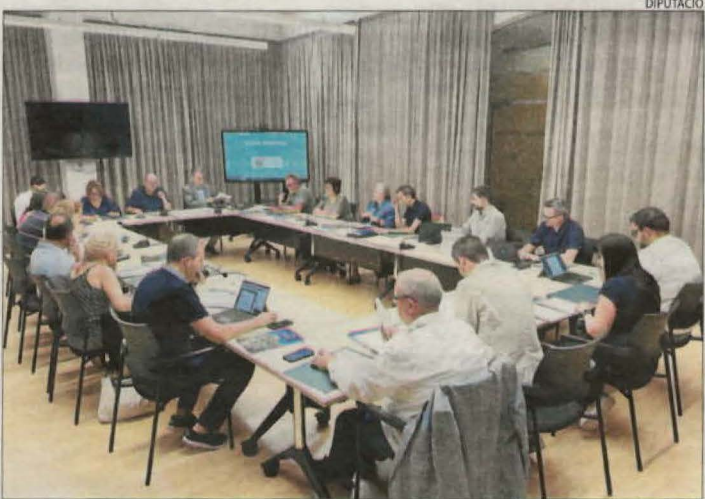
Reunió ahir de la junta general del Patronat.