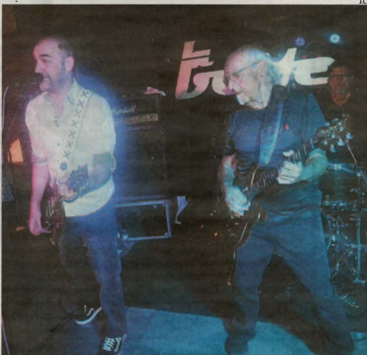
El guitarrista i flautista Martin Barre (a la dreta), a La Boîte.