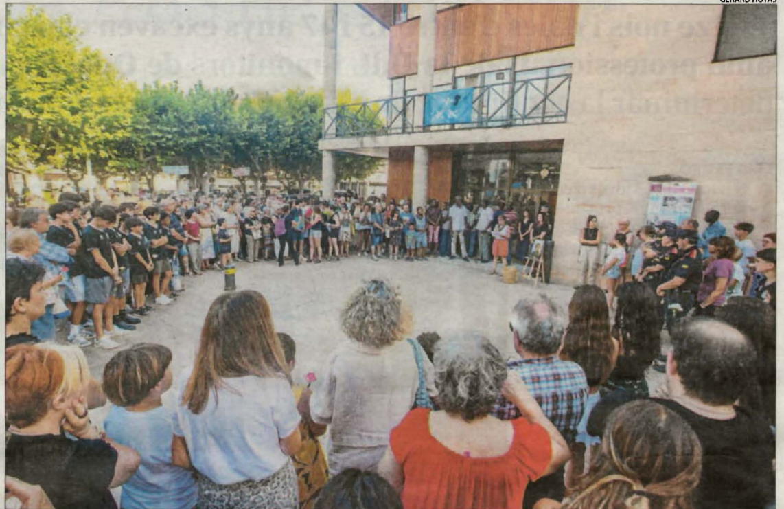
Imatge del minut de silenci a Tremp per recordar el nen ofegat a Sant Antoni.

Per una altra banda, Tremp va viure ahir a la tarda un mul-