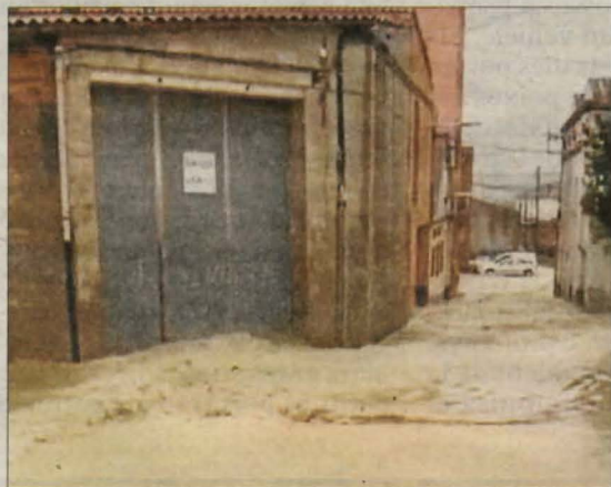
El carrer de la Rasa d'Oliana inundat d'aigua.