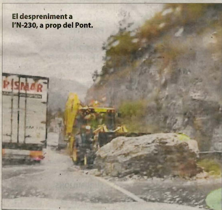
El despreniment a l'N-230, a prop del Pont.