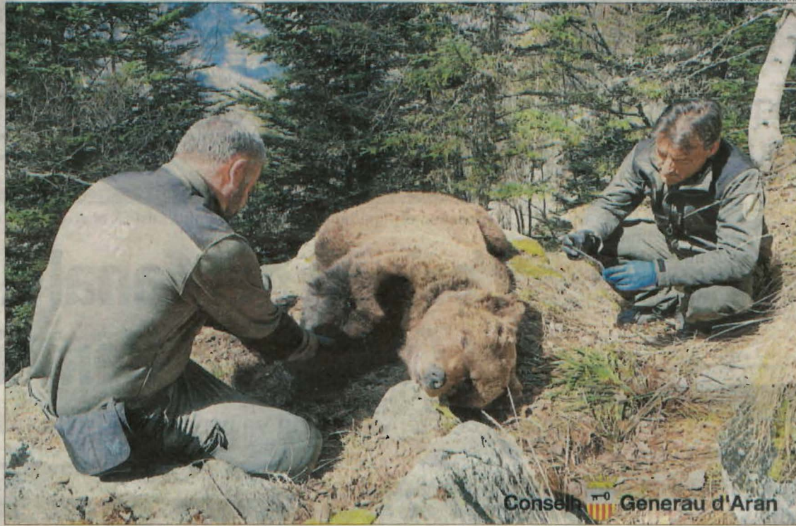
Cachou va ser trobat el 9 d'abril del 2020 i inicialment es va pensar que va morir per una caiguda.

Per la seua part, Medan és acusat d'un delictes de violació de secrets i dos delictes contra la fauna i el fiscal, a més de la presó, també demana una multa de 5.400 euros, que se li inhabiliti per a ocupació o càrrec públic durant un any i sis mesos i tres anys i mig per a l'ofici d'agent de medi ambient i que se li prohibeixi caçar i pescar durant cinc anys i quatre mesos.