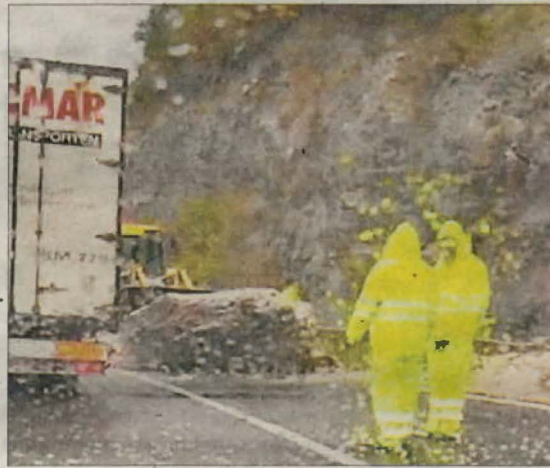
Operaris retirant la roca de l'N-230.