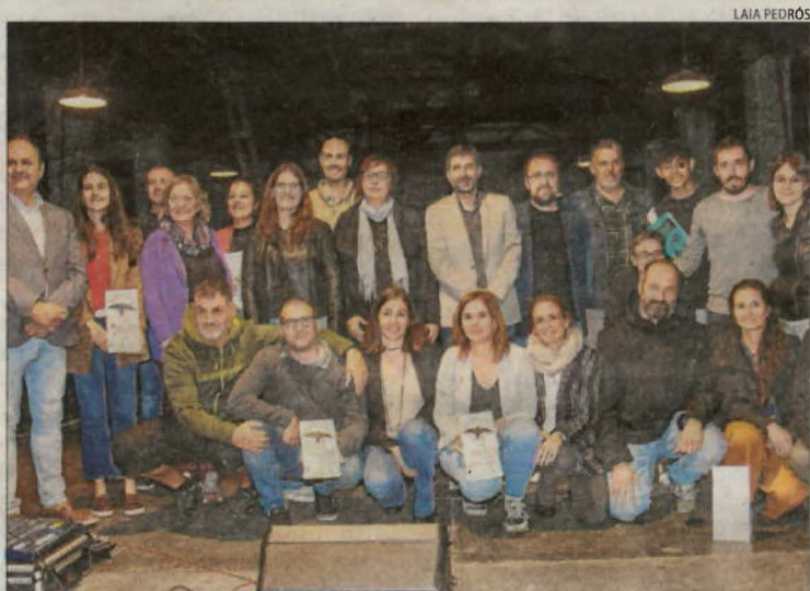
Projectes cooperatius premiats ■ Ponent Coopera va entregar a Tàrrrega el 2n Reeixim L'Oest a Units Energy (Garrigues), Tapiem (Noguera), La Tàpia (Pla), Espai Essen (Segrià) i Spasa (Urgell).