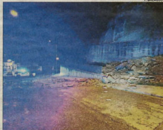
L'esllavissada que va tallar un carrer a Balaguer.

i una amenaça, especialment quan plou". La tempesta va fustigar Vilaller cobrint de blanc els carrers de la localitat. A Oliana, la pluja va provocar inundacions al carrer de la Rasa i l'acumulació d'aigua va embussar diversos embornals. L'alcalde,