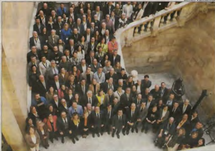
Representants d'entitats locals rurals, ahir al Parlament.

Així, el projecte de llei proposa aplicar a l'IRPF deduccions del 15% del que es paga en concepte de lloguer d'habitatge principal a l'exercici fiscal que