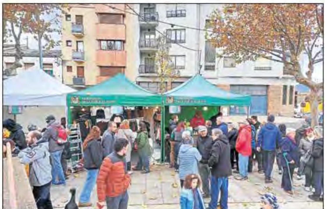
El recinte firal va estar freqüentat des de l'obertura al matí fins ben entrada la tarda.

L'esdeveniment, que aquest any ha reunit 23 paradistes a les carpes ubicades a l'aire lliure al passeig que discorre al costat del poliesportiu de la Pobla, pròxim a la carretera N-260, se centra en les propostes d'alimentació i d'artesanía de