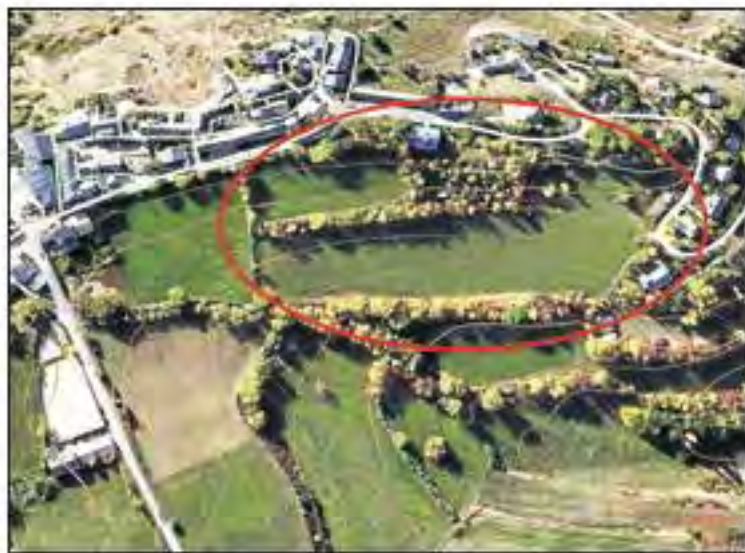
Una de les tres futures zones d'expansió urbanística de Tírvia.

Pot semblar paradoxal que aquesta previsió de creixement es doni en un municipi que porta anys intentant atreure famílies per mantenir oberta l'escola, encara que, en realitat, la proposta, que es coneix quan l'habitatge se situa com un dels principals problemes del Pirineu tal com es va veure en la freqüentada manifestació de divendres a la Seu, redueix les anteriors previsions de desenvolupament, les del 2003, en l'època d'una bombolla immobiliària que no va arribar a unflar-se, ni després a esclatar, a Tírvia.