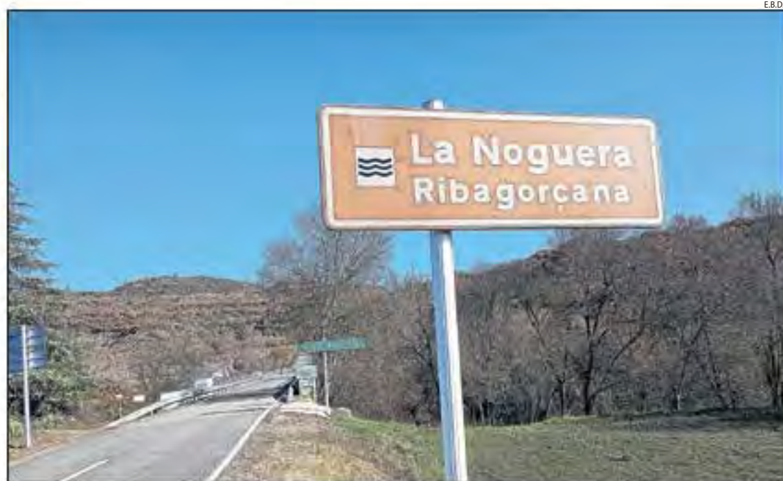
Tremp, al Jussà, i el Pont de Montanyana, a la Ribagorça oscenca, són municipis limítrofs.

El fet de tractar-se d'una herència abintestat (no tenia fills, la seua única germana va morir abans que ell i els fills d'aquesta no s'han interessat per acceptar-la) fa que aquesta passi a integrar el patrimoni del Govern d'Aragó, que destina aquests llegats, o els diners recaptats amb la seua venda, a finançar programes socials. Tanmateix, tampoc aquest tràmit d'accep-