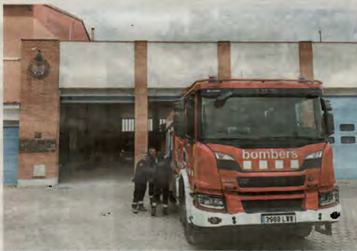
Bombers del parc de Tremp a la Pobla

Salzer manifesta que un bomber s'ha de poder dutxar després d'un servei i més quan de vegades treballen amb productes tòxics. Pel que fa al fred, apunta que en alguns espais del Parc de Tremp