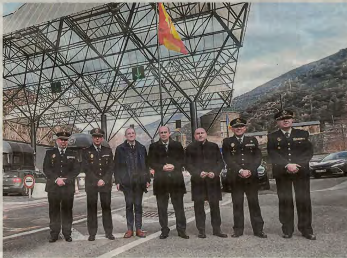
Imatge de les autoritats que van estar ahir presents a l'acte

Durant la jornada commemorativa es va tractar