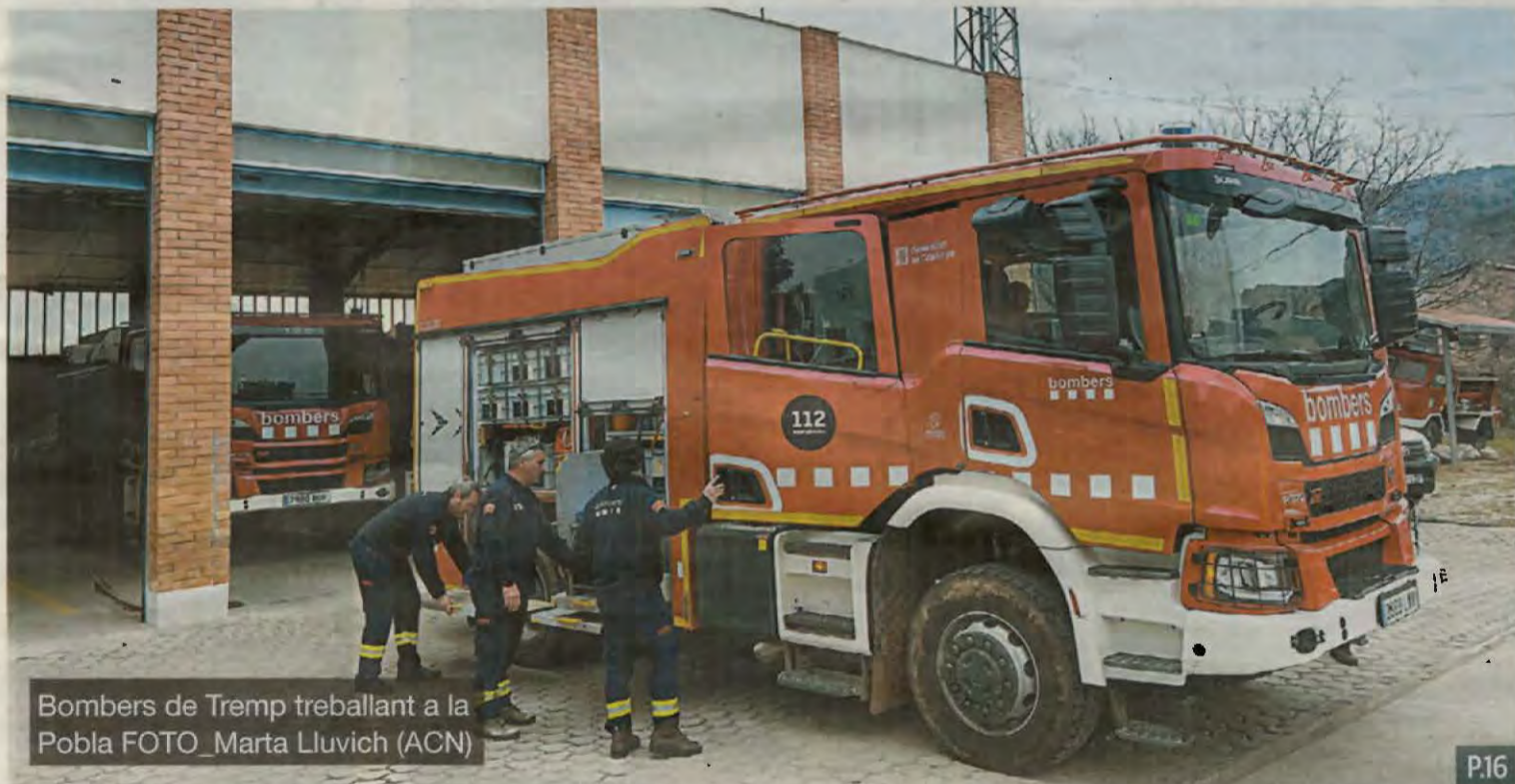
Bombers de Tremp treballant a la Pobla

Interior espera que l'avaria en la caldera, que també ha deixat les instal·lacions sense aigua calenta, es pugui resoldre aviat