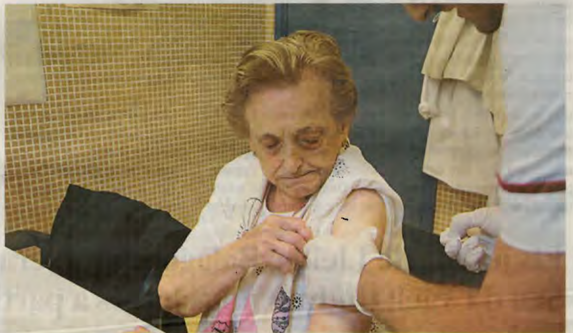
Una dona rep la vacuna contra la grip en un centre d'atenció primària

El Departament de Salut apunta que "durant aquesta setmana sembla que s'ha arribat al màxim pic epidèmic", tot i que afegeix que "hem d'esperar uns dies per poder-ho confirmar". Segons les dades del Sistema d'Informació per a la Vigilància d'Infeccions a Catalunya