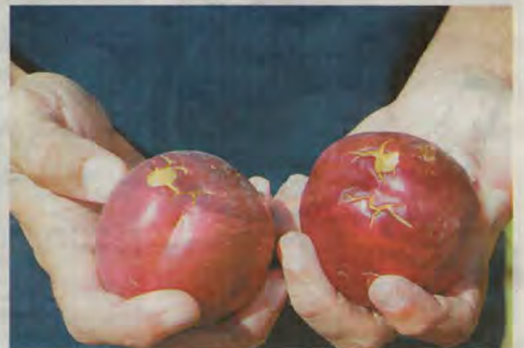
Dues nectarines danyades a Aitona

han baixat de 10 a 4, segons les dades del SIVIC. La grip a Catalunya ha passat dels 375 als 439 casos per 100.000 habitants i supera el nivell de transmissió molt alt amb 80.000 casos per cada 100.000 habitants.