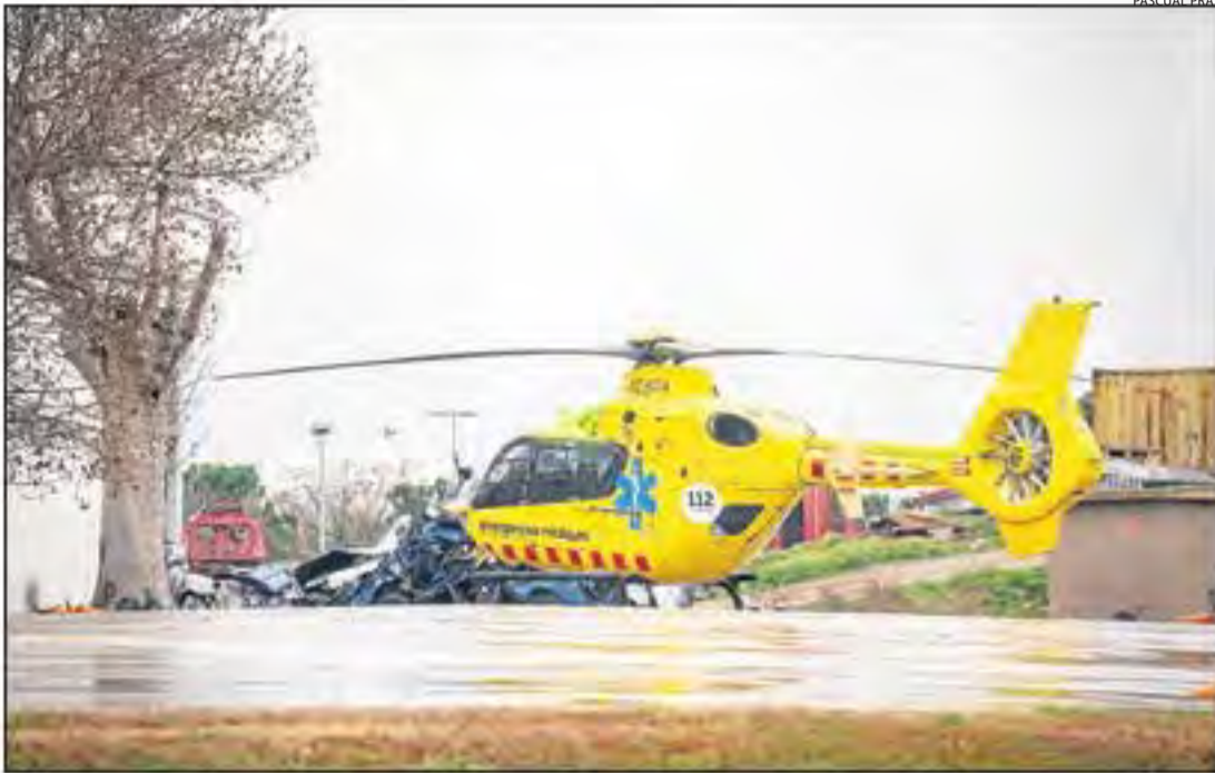
L'helicòpter del SEM, a l'àrea d'aterratge del parc de Bombers de Lleida.