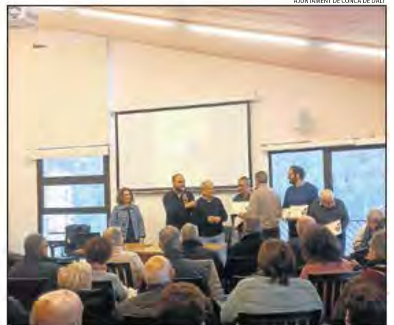
Entrega dels reconeixements als productors del Jussà.

Per avui està previst el mercat de productes de proximitat, maquinària agrícola, productes agroalimentaris i la degustació d'olis. La jornada s'iniciarà amb un esmorzar de fira i hi haurà tallers i visites al Molí d'Oli d'Aramunt.