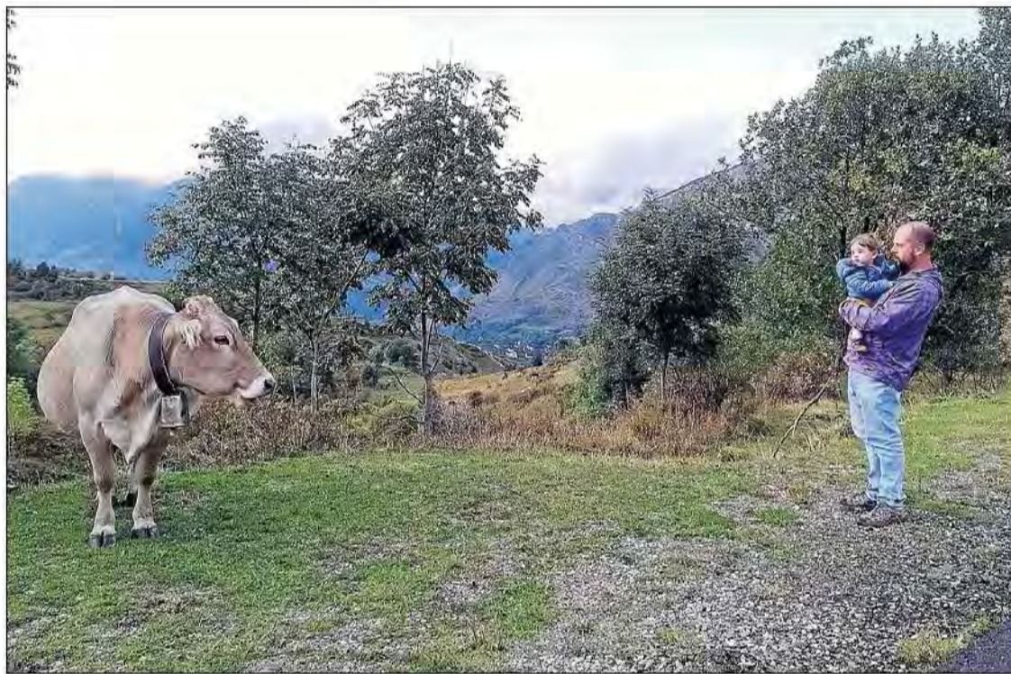
Rubén Ruiz, amb el seu fill Odin davant d'una vaca en un prat del Pirineu lleidatà.

El producte elaborat a l'obra-dor de Tremp ofereix 8,2 grams