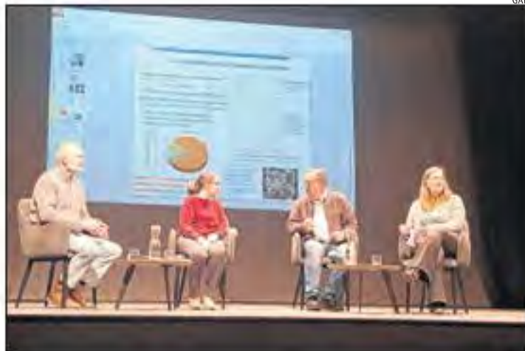
Un moment de la jornada celebrada dijous a Juneda.