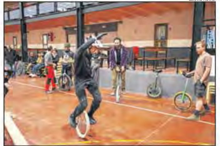
Una de les exhibicions que es van fer al pavelló.

LLEIDA | L'Albi és aquest cap de setmana escenari d'un singular encontre d'aficionats als monocicles. L'esdeveniment, organitzat per Damià Farré, veí del poble, ha reunit una quinzena de participants d'aquesta modalitat esportiva, principalment procedents de diverses zones de Navarra, la Rioja o el País Basc i també de Catalunya. La trobada, de caràcter no competitiu, va començar ahir amb una ruta de descens d'uns tres quilòmetres des de l'ermita de Sant Joan, a Montblanc.