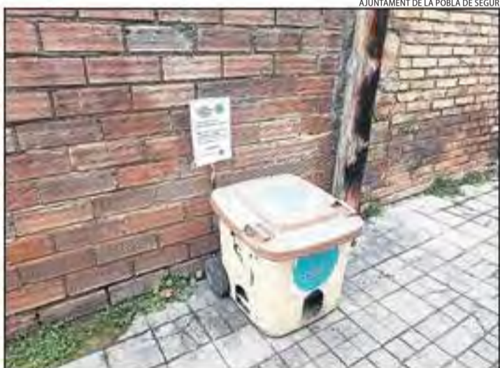
Contenedor de menjar habilitat per als gats de carrer.

Fins al moment s'han esterilitzat gats de diferents colònies felines de les localitats del municipi de la Pobla de Segur. Està previst que, al llarg d'aquest any, es vagin portant a terme altres actuacions similars amb l'objectiu de controlar la proliferació d'aquests animals a la via pública.