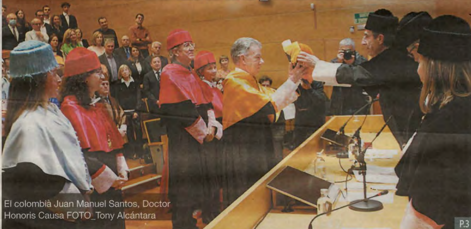
El colombià Juan Manuel Santos, Doctor Honoris Causa