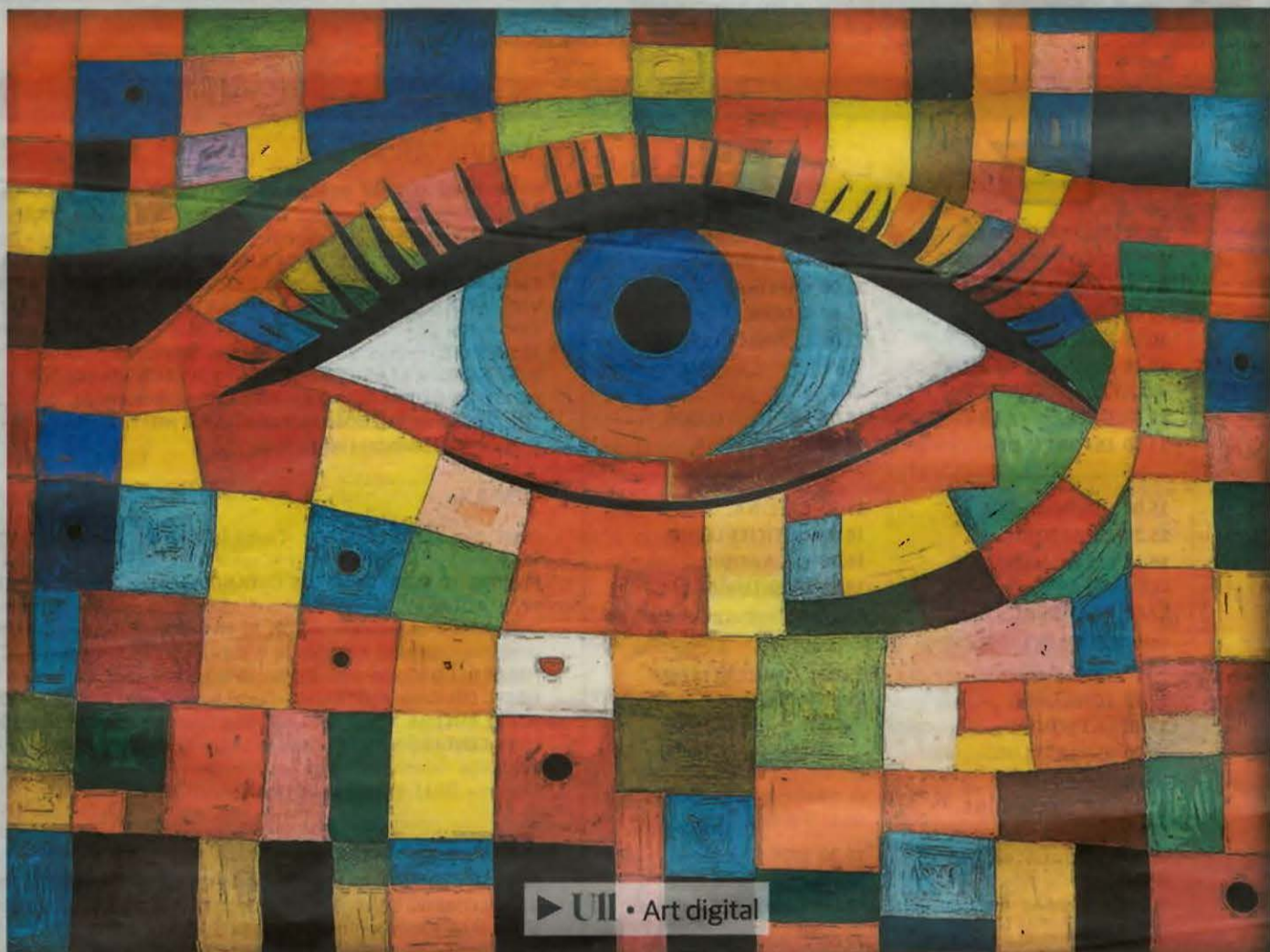
► UII · Art digital

I https://www.instagram.com/ama10art/ | https://www.facebook.com/amadeu.boldu | Comissariat per: @cerlebellesartslleida · Cba Lleida · youtube: @cerlebellesartslleida | https://cerlebellesartslleida.com