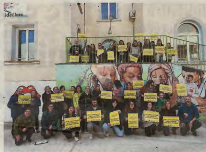
Pares i mares d'alumnes

quatre a Catalunya Central i tres al Camp de Tarragona i Terres de l'Ebre. Tot i que són situacions que no són freqüents, alguns parts poden comportar complicacions. Girona va acollir ahir la 'Jornada d'actualització de part extrahospitalari' que va comptar amb la participació de 400 professionals.