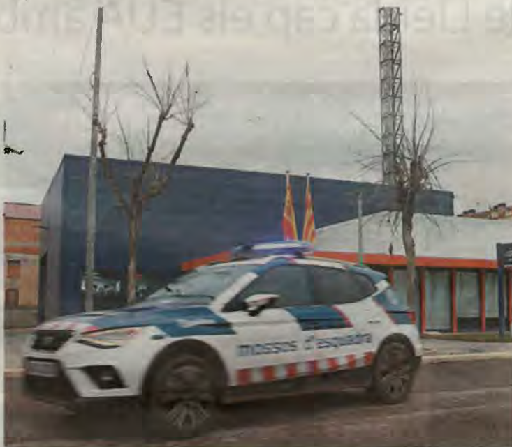
Comissaria de Mollerussa

Prop del lloc, la policia va localitzar un primer vehicle amb el vidre trencat i dues bosses a terra amb