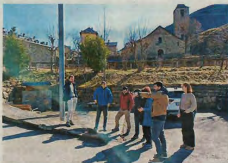
Un dels punts estudiats seran els parquings del municipi

guretat viària en municipis rurals de Catalunya. Tots dos projectes s'implementaran durant aquest any. El centre de recerca i2CAT desenvoluparà els dos projectes pilot basats en tecnologies digitals avançades per a la millora de la seguretat viària i el control de l'afluència.