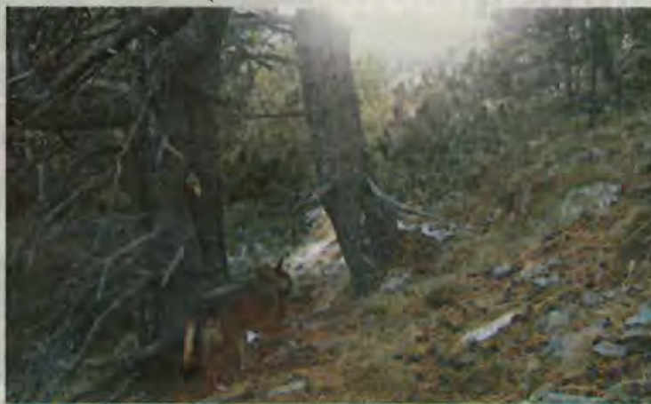
Exemplar de llop al parc natural de l'Alt Pirineu en el terme municipal d'Alins

Els agents rurals investiguen un possible atac de llop a un ramat d'ovelles del municipi de Castell de Mur, al Pallars Jussà. L'atac es va produir el cap de setmana i el dilluns dia 17 es va fer la necròpsia dels animals i no es descarta el llop com a possible causant dels danys. L'administració ha iniciat actuacions de seguiment a la zona, s'ha activat el