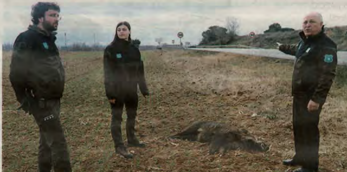
Agents rurals al costat d'un senglar mort per atropellament a la C-12

El primer accident va passar cap a les 23.00 hores a l'encreuament entre la C-12 amb l'A-2, poc